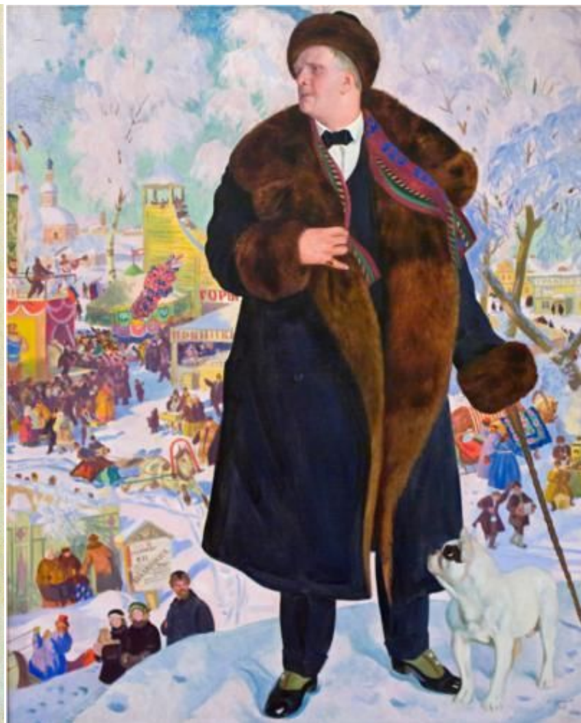
Б. Кустодиев. Портрет Ф.И. Шаляпина