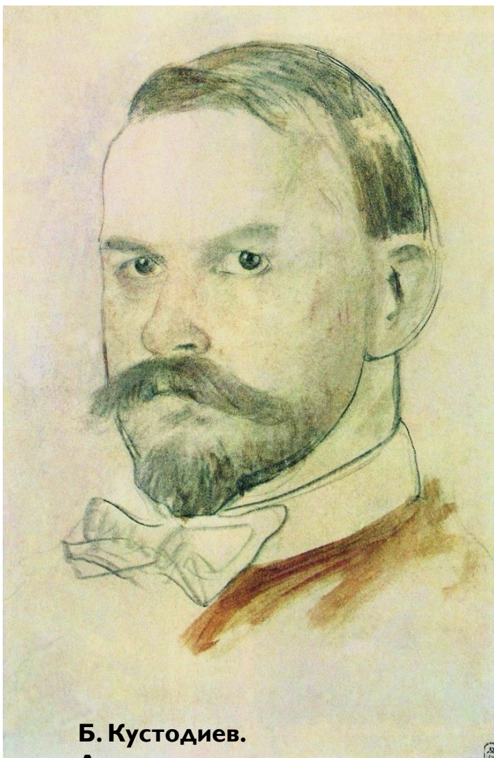
Б. Кустодиев. Автопортрет