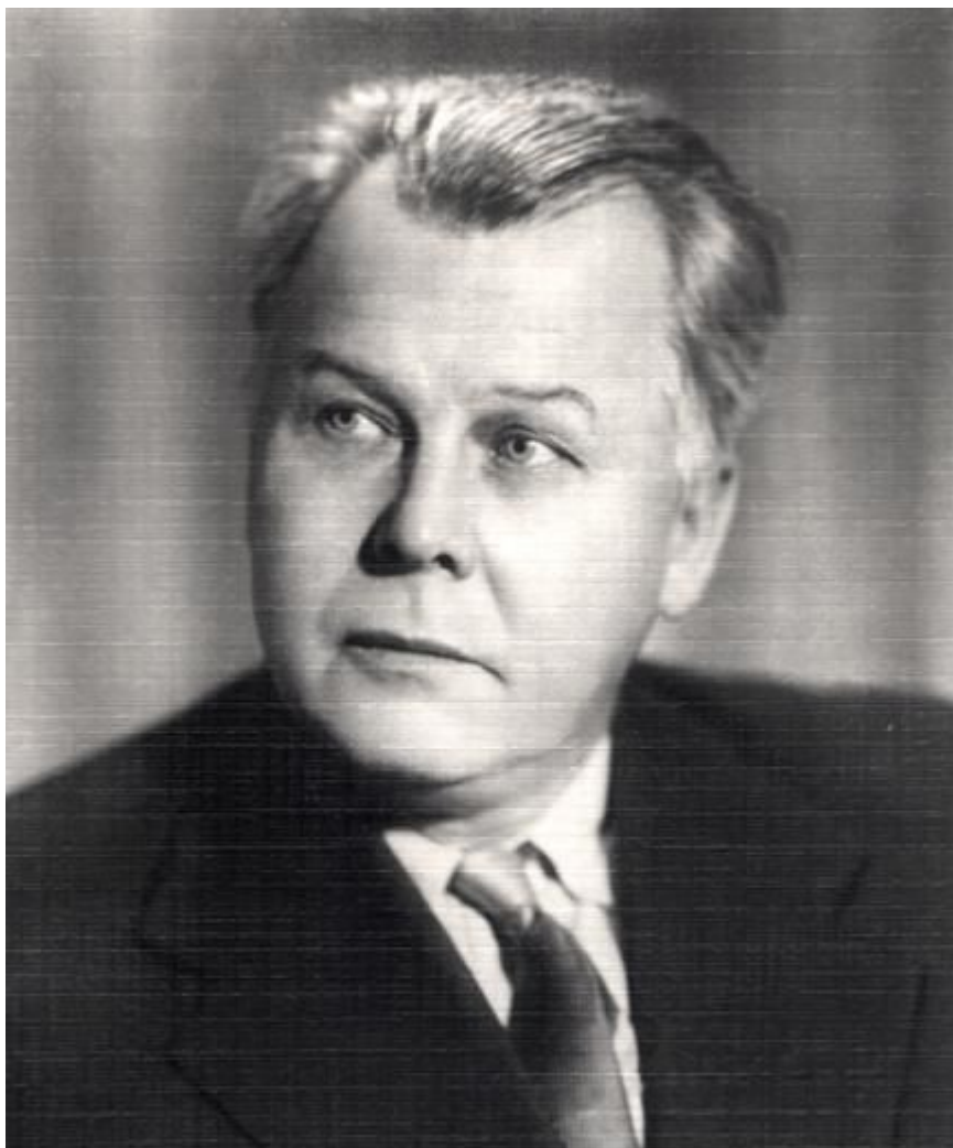
Александр Трифонович Твардовский, автор поэмы «Василий Теркин»