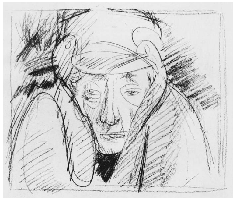
Рис .В.Н. Горяева