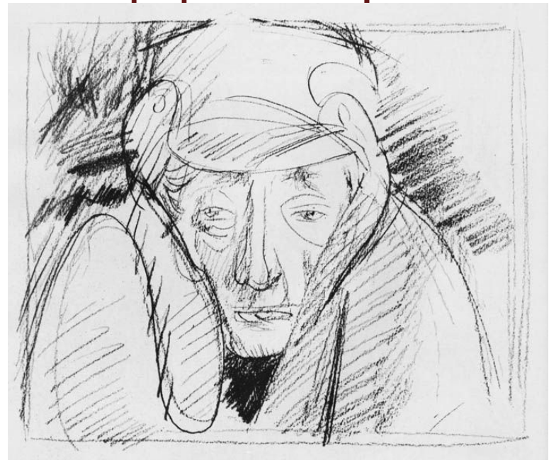
Рис .В.Н. Горяева

Лошадь, дунувшая в щеку Акакию Акакиевичу, производит «целый ветер». Эта деталь подчеркивает малость, незащищенность героя.