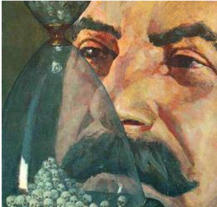
П.Белов. Песочные часы.

В 30-е гг. была завершена ликвидация разномыслия в художественной культуре. Отныне искусство должно следовать одному направлению-социалистическому реализму и показывать жизнь такой, какой она должна быть в представлении партийных вождей. Искусство стало насаждать мифы и создавать иллюзию, что счастливое время уже наступило. Используя его власти умело манипулировали общественным мнением и направляли его в нужное русло.