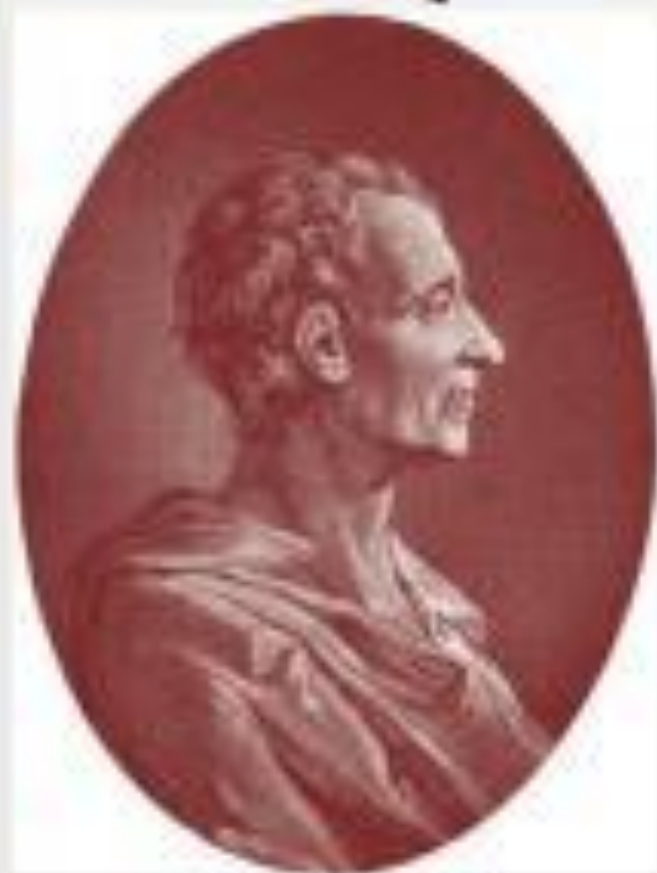
Шарль Луи Монтескье (1689-1755 г.г.)