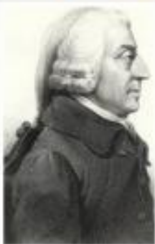
Адам Смит 1723 – 1790 г.г.