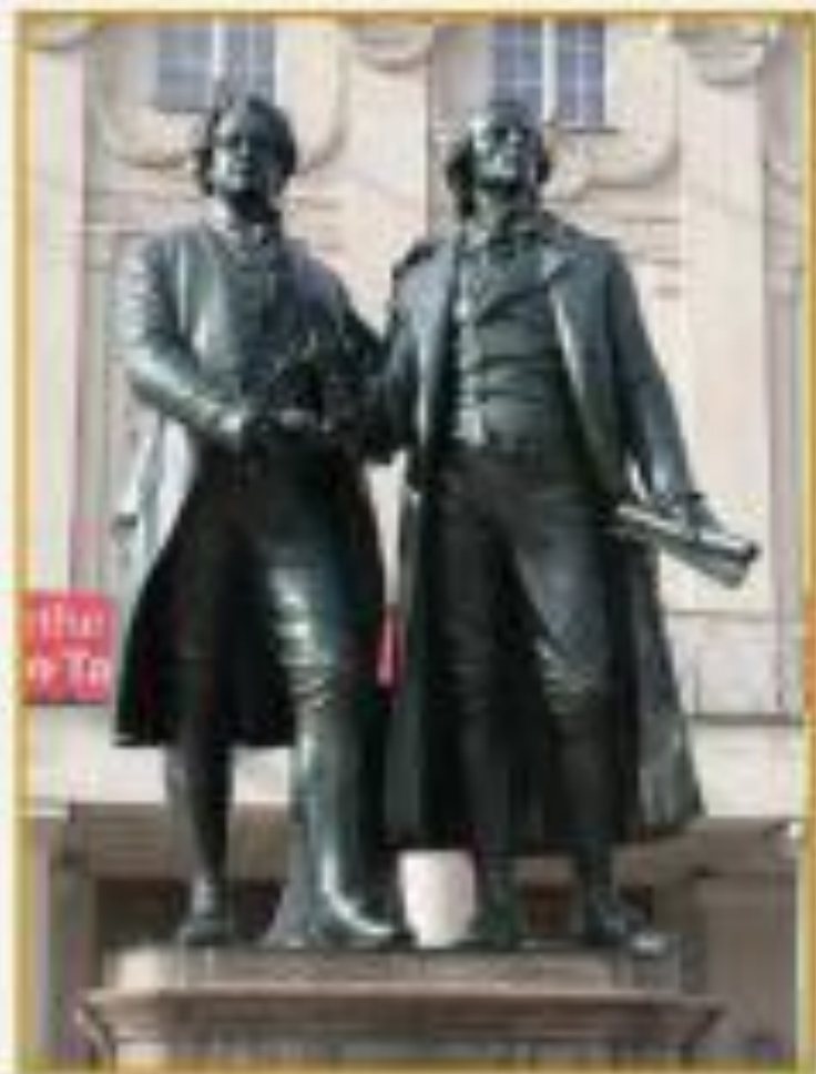
Памятник Гёте и Шиллеру у здания театра в Веймаре