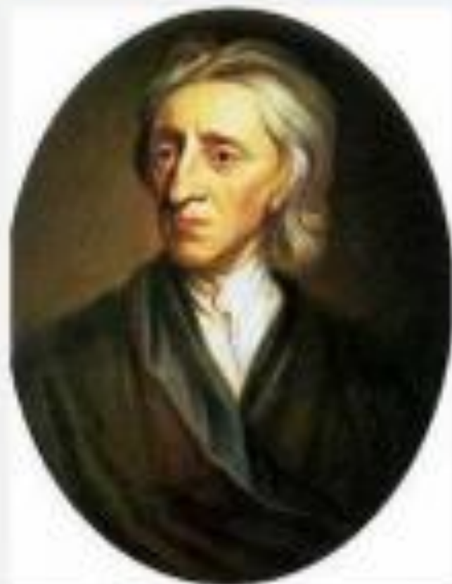
Джон Локк 1632 – 1704 г.г.