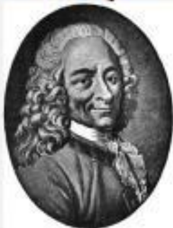
Вольтер Франсуа Мари Аруэ (1694-1778 гг.)