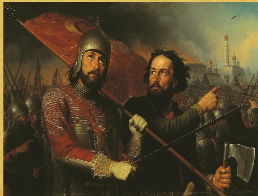
М. И. Скотти. «Минин и Пожарский» (1850). Красное знамя с иконой, которое несёт князь, исторически достоверно.