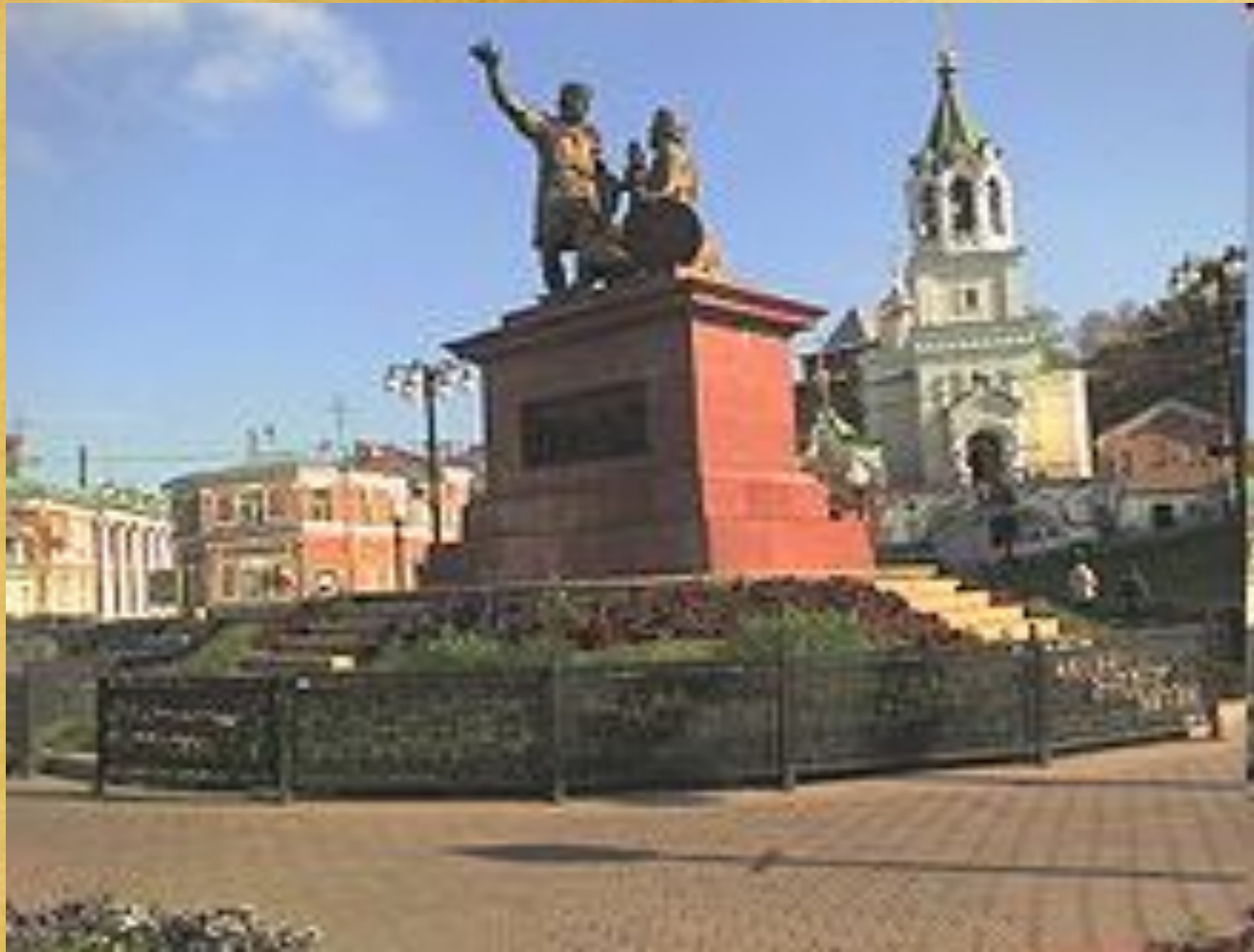
Памятник Минину и Пожарскому в Нижнем Новгороде