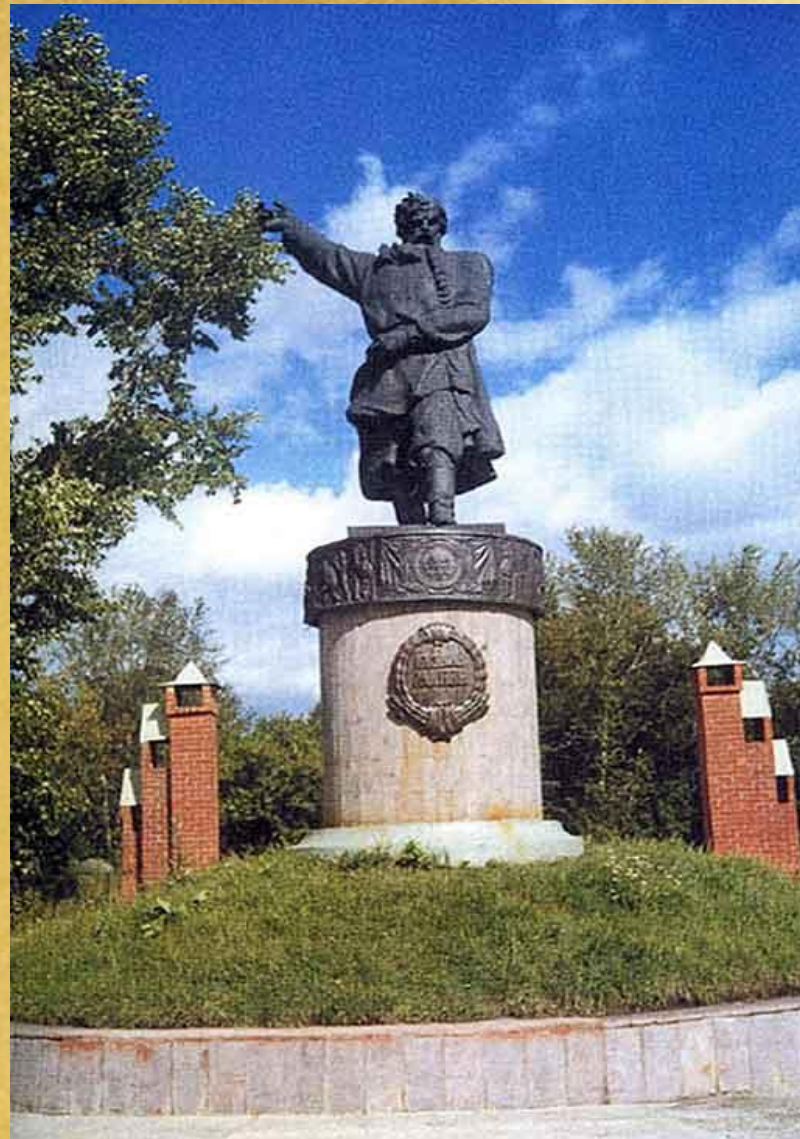
Памятник Кузьме Минину на его родине в городе Балахна