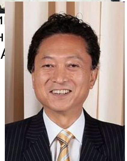
Хатояма Юкио с 2009 года