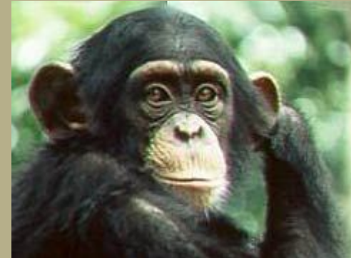
Шимпанзе обыкновенн ый