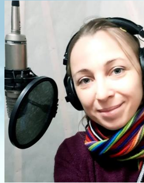
Наталія КАЛЮЖНА Акторка