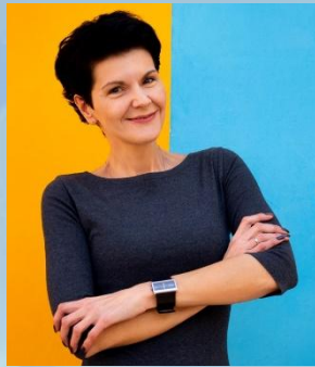
Вікторія ПОЛЬЧЕНКО Акторка