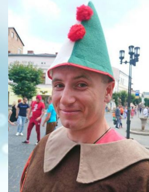
Олекса МЕЛЬНИК Актор