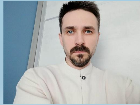
Іван МАРЧЕНКО Актор