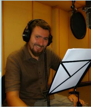
Роман ЧУПІС Актор