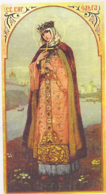
Икона «Святая равноапостольная княгиня Ольга» (годы жизни 890—969)

Предание нарекло Ольгу Хитрою, Церковь Святою, История Мудрою. Великие князья до времен Ольгиных воевали: она правила государством.