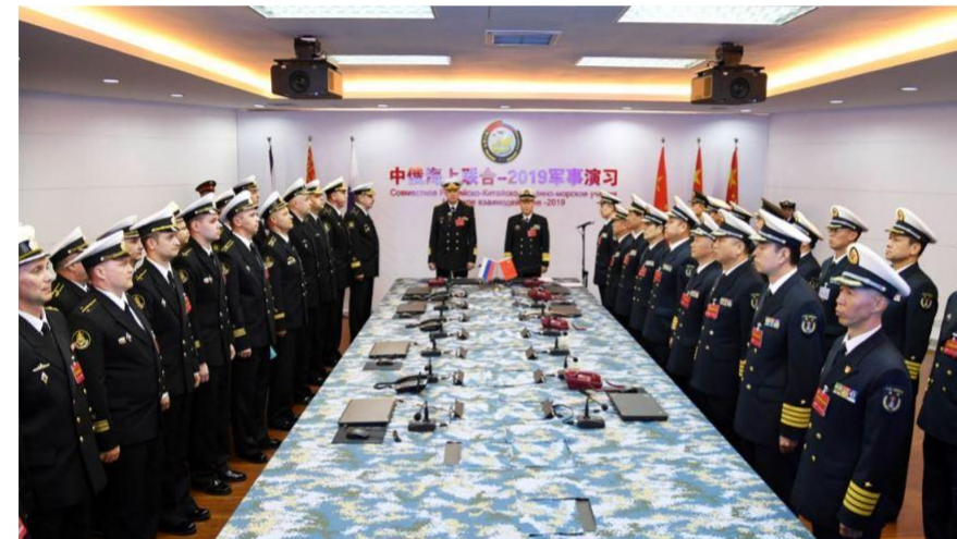
April 29, 2019. Qiu Yanpeng (C.R.) chief director of 'Joint Sea-2019' exercise from the Chinese side and deputy commander of the Chinese People's Liberation Army (PLA) Navy declares the opening of the Sino-Russian exercise in Qingdao, east China's Shandong Province.