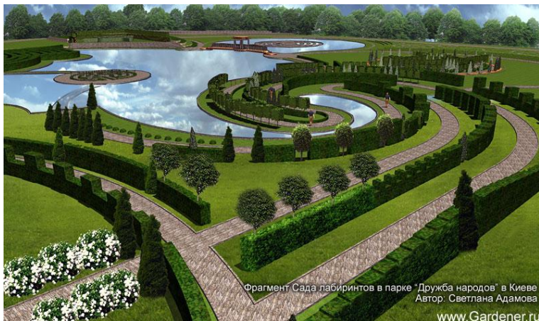
Фрагмент Сада лабиринтов в парке "Дружба народов" в Киеве