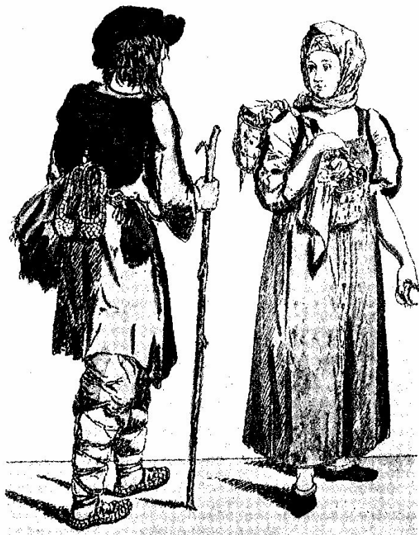
К. А. Зеленцов. Крестьянин и крестьянка. Офорт. XVIII в.

Рост мануфактур привел к увеличению числа рабочих людей. Условия труда были тяжелыми. Рабочие люди протестовали против таких условий работы.