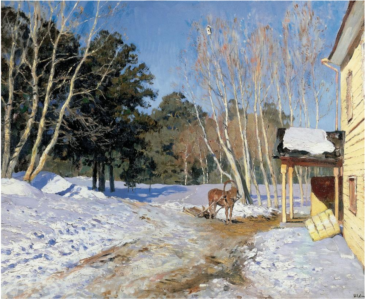
Март. 1895 г.