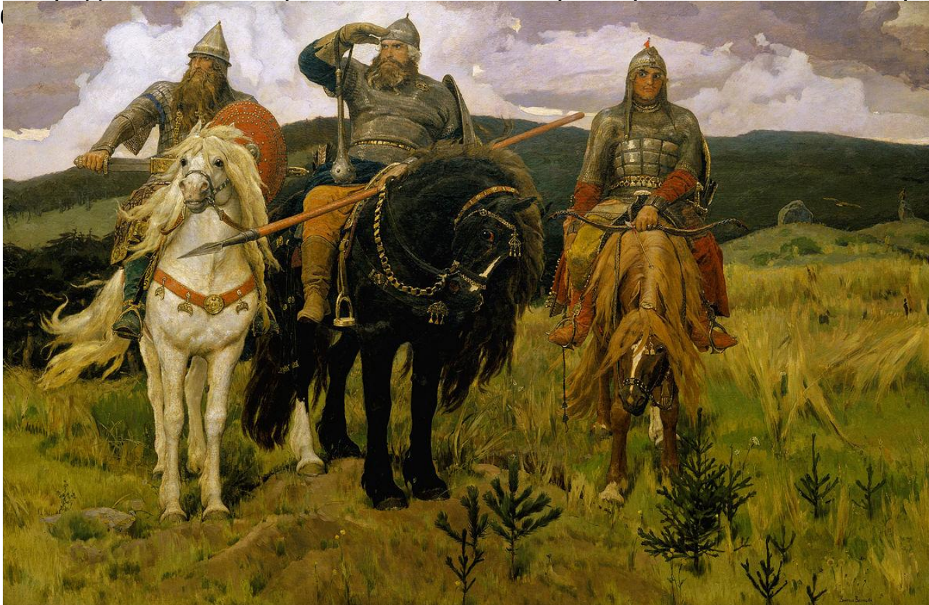
Богатыри. 1881—1898 гг.