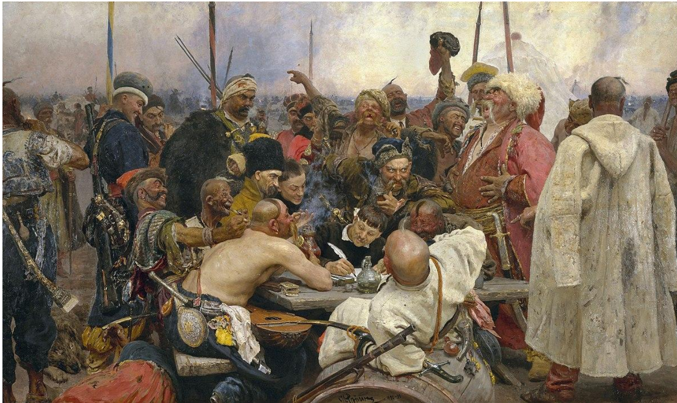
«Запорожцы пишут письмо турецкому султану» (1878-1891 гг.)