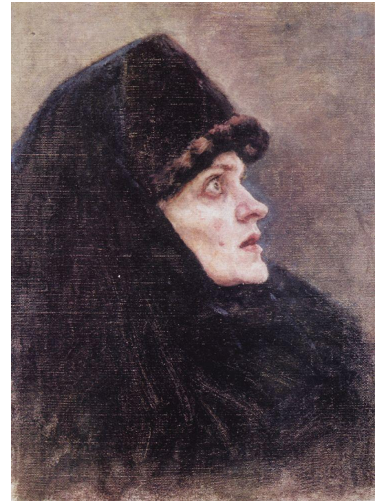
Наброски к картине «Боярыня Морозова».