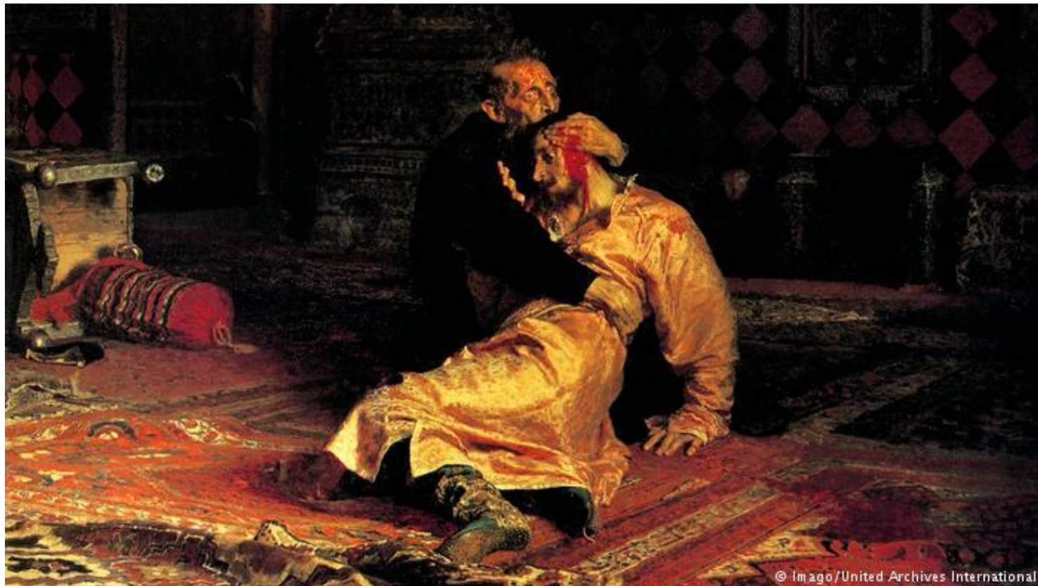
«Иван Грозный и сын его Иван 16 ноября 1581 года» (1885 г.)