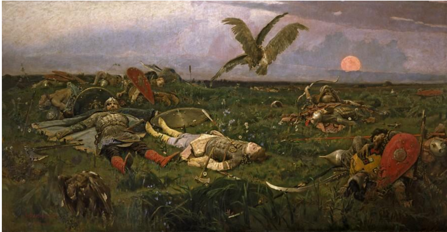
«После побоища Игоря Святославича с половцами» (1880 г.).