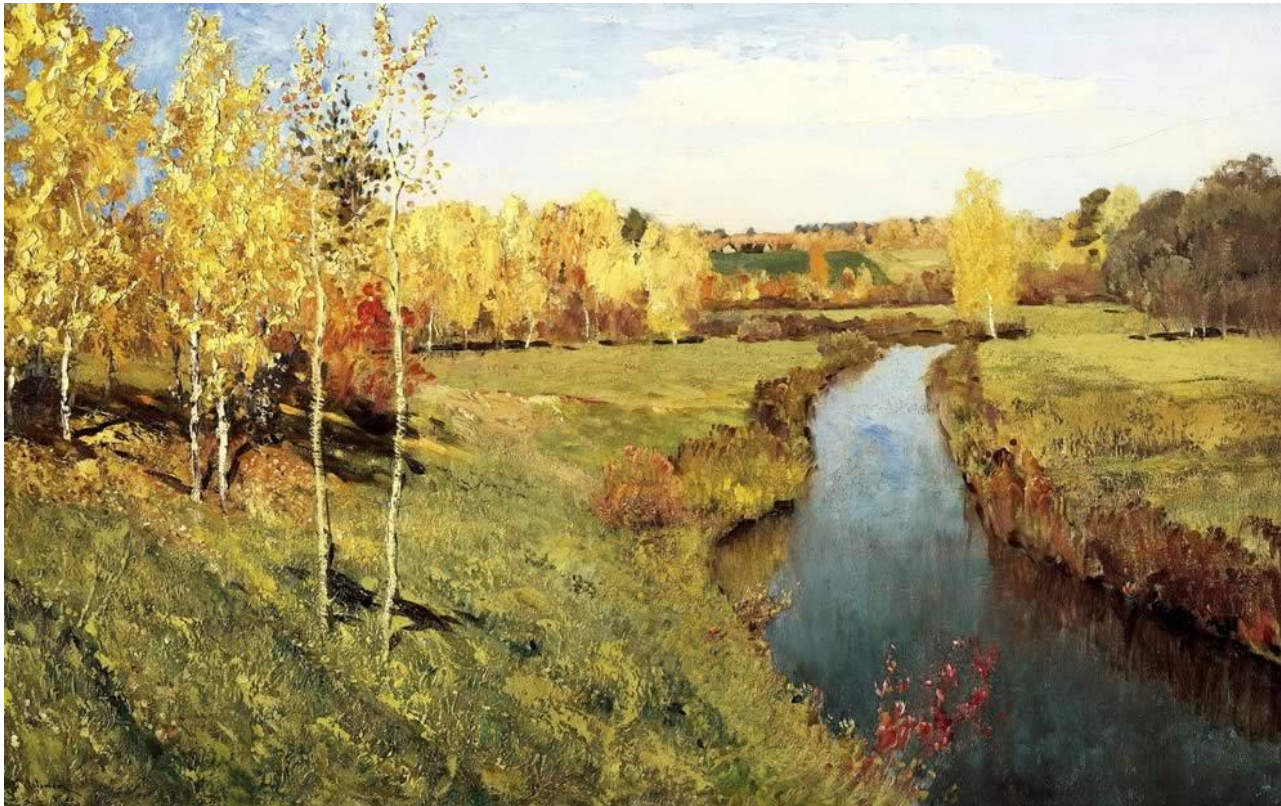
«Золотая осень» (1895 г.)