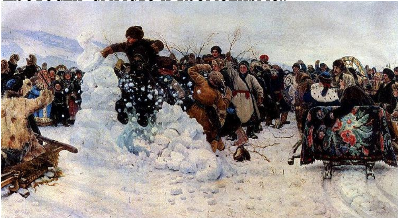
Взятие снежного городка. 1890 г.