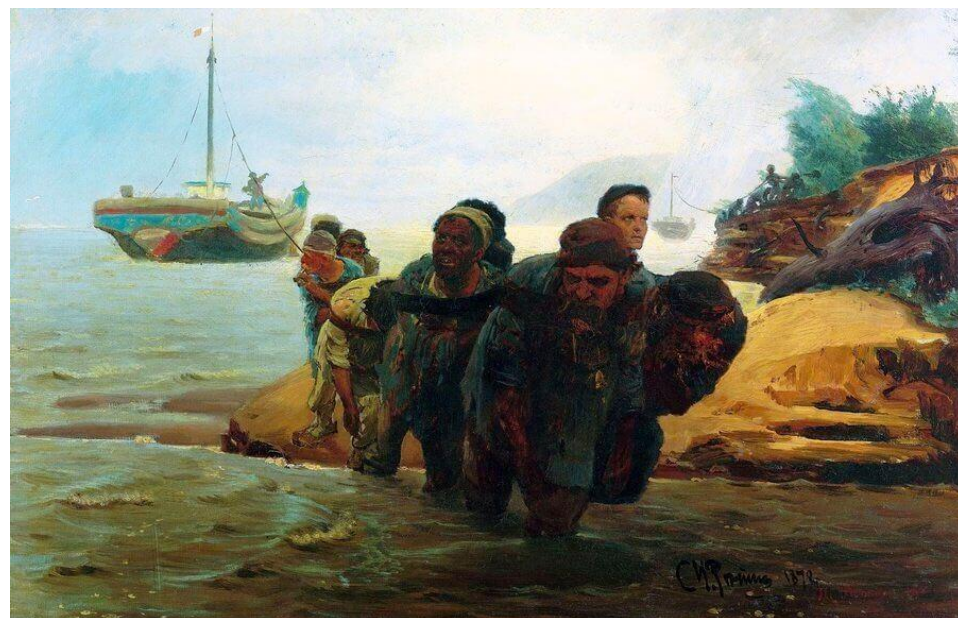
Илья Репин. Бурлаки, идушие вброд. 1872 г.