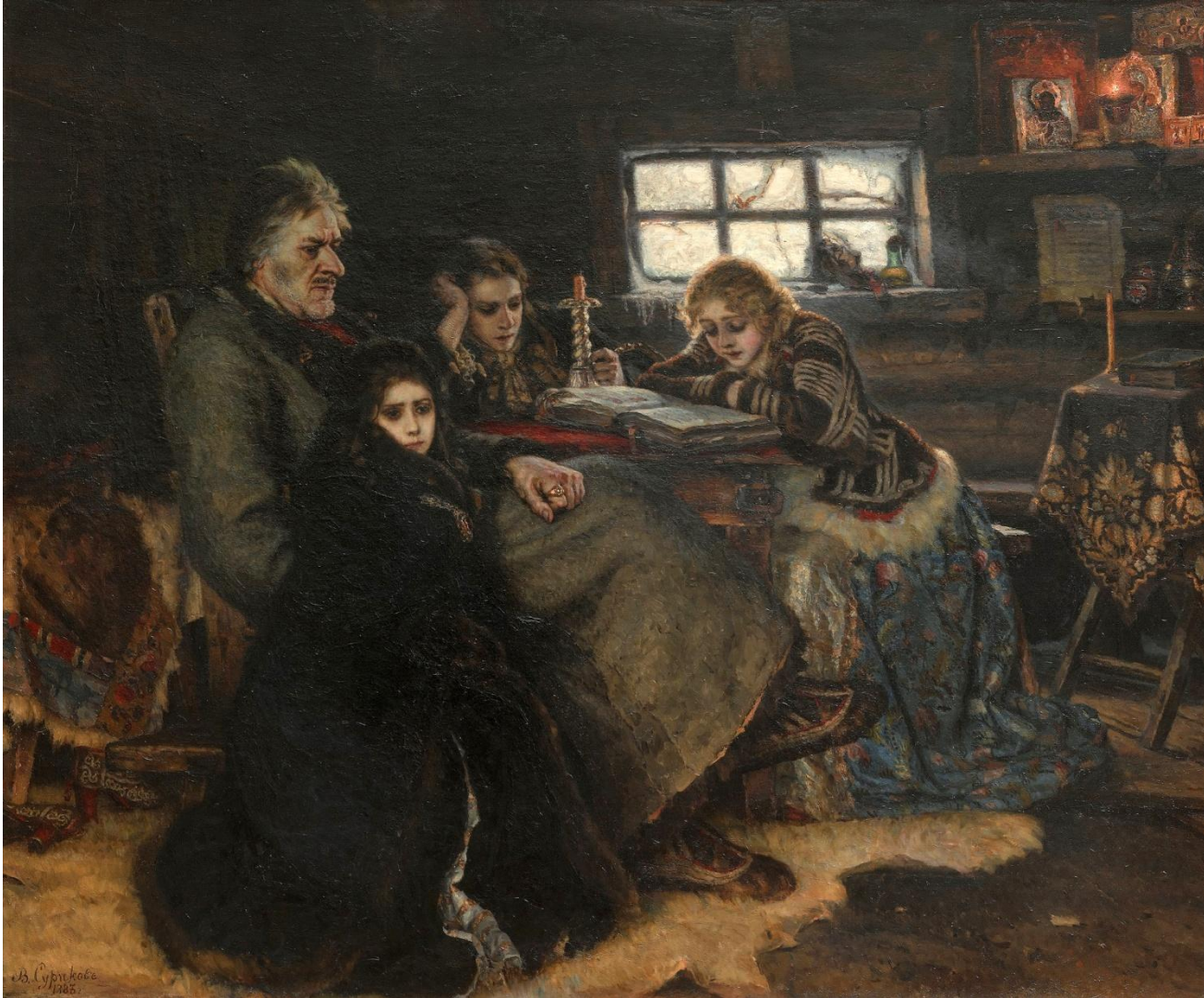
«Меншико в в Берёзове» (1883 г.)