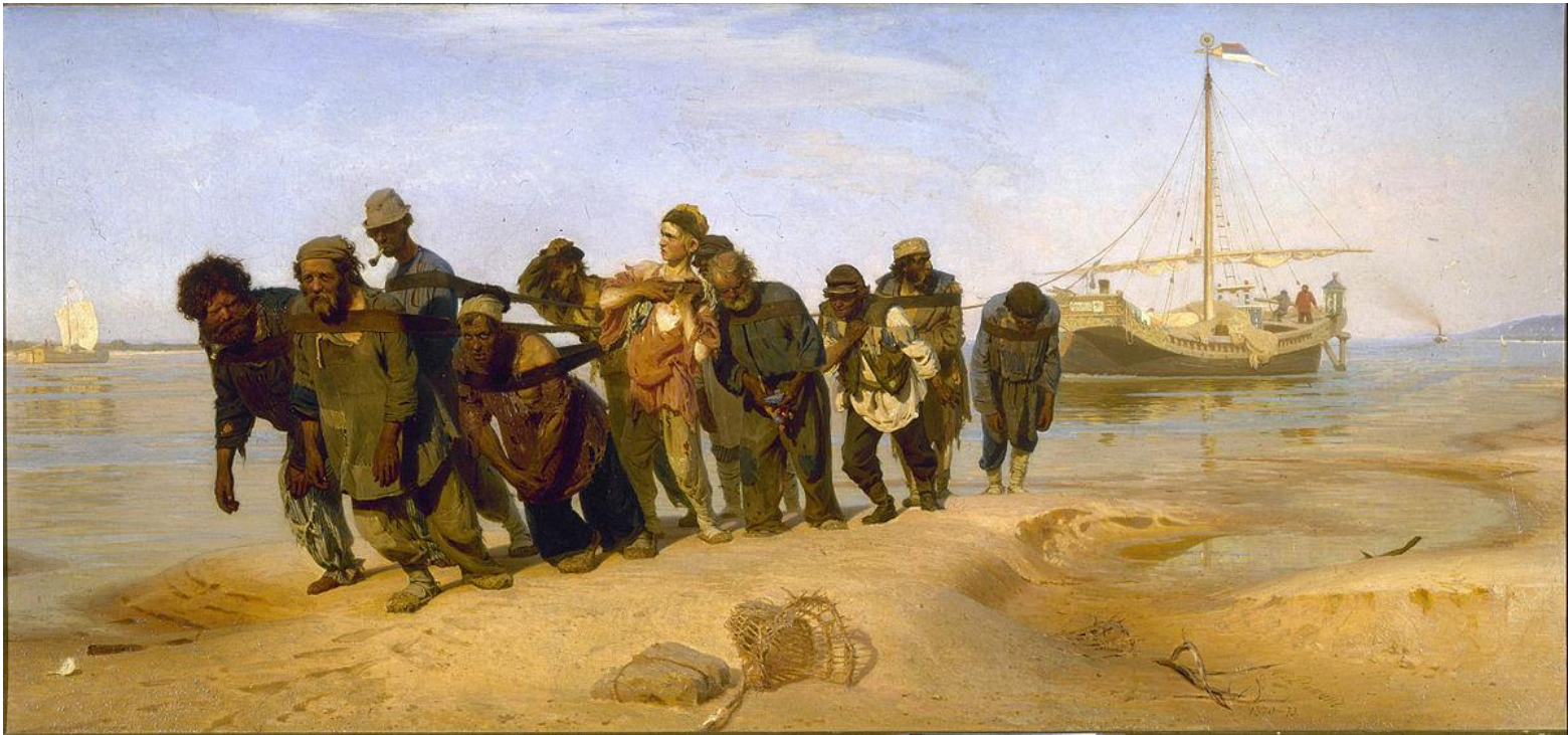
Бурлаки на Волге. 1870—1873 гг.