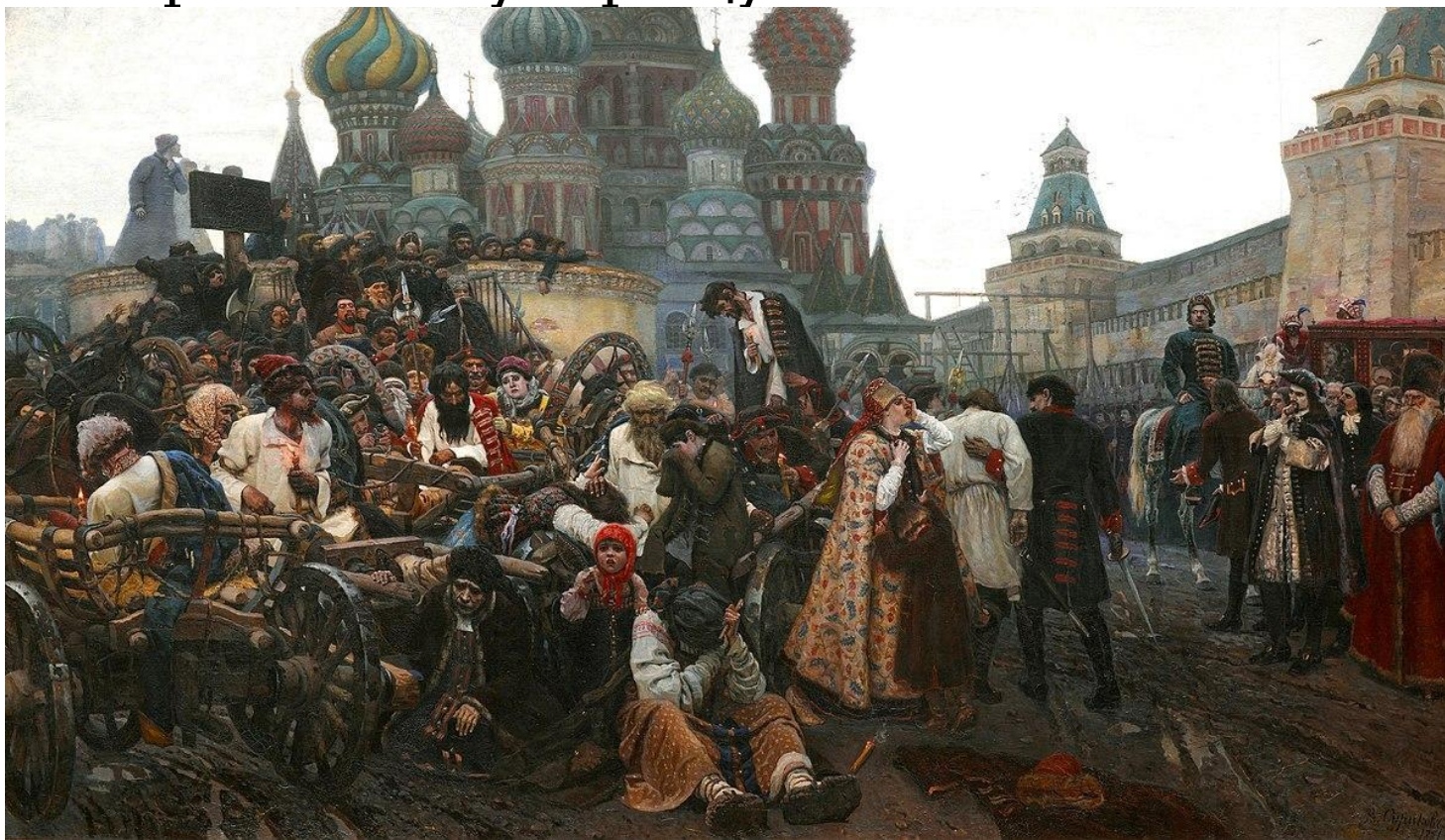
«Утро стрелецко й казни» (1881 г.)