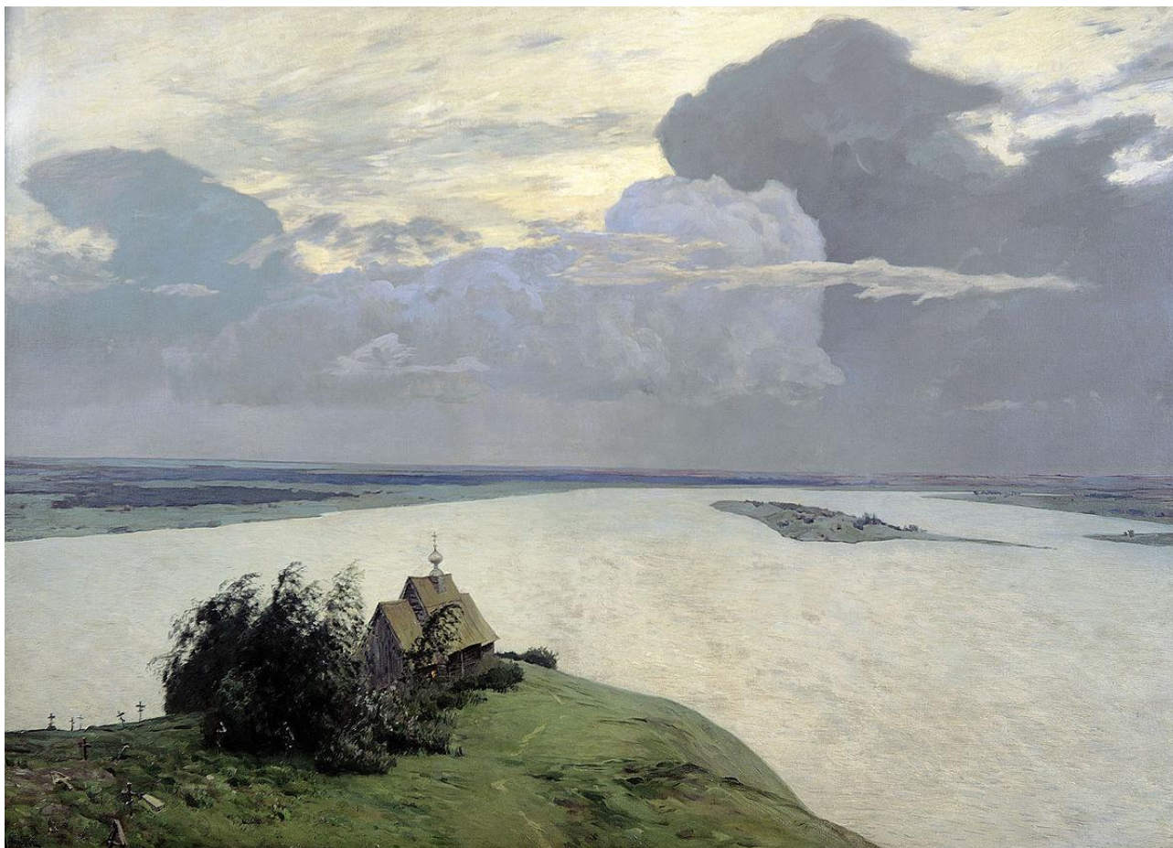
«Над вечным покоем» (1894 г.)