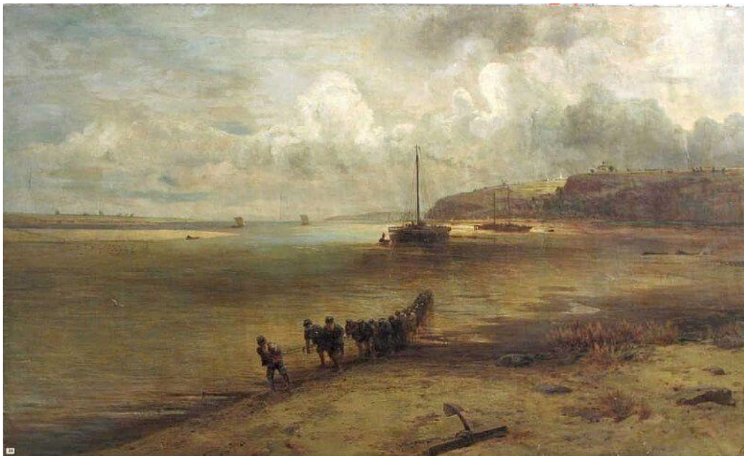
Алексей Саврасов. Бурлаки. 1870 г.