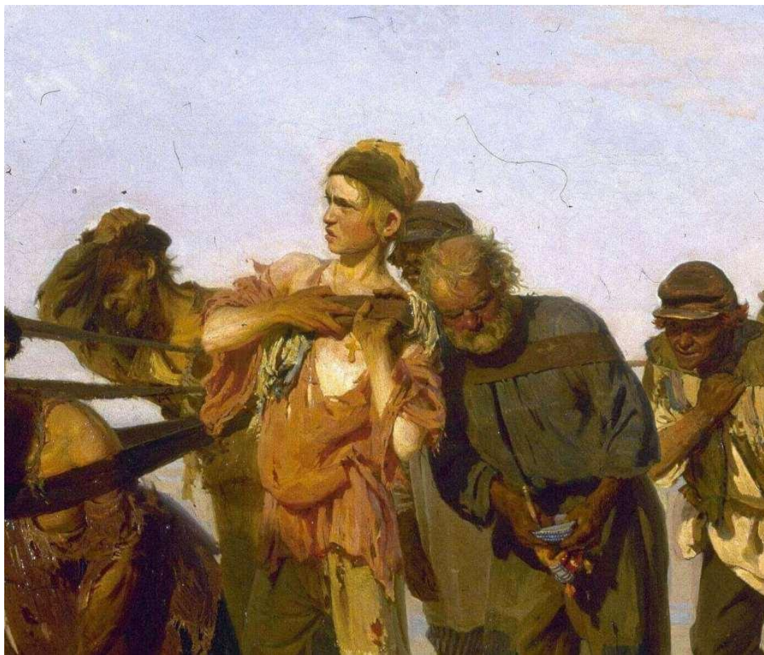
Илья Репин. Деталь “Бурлаков на Волге”. 1873 г.