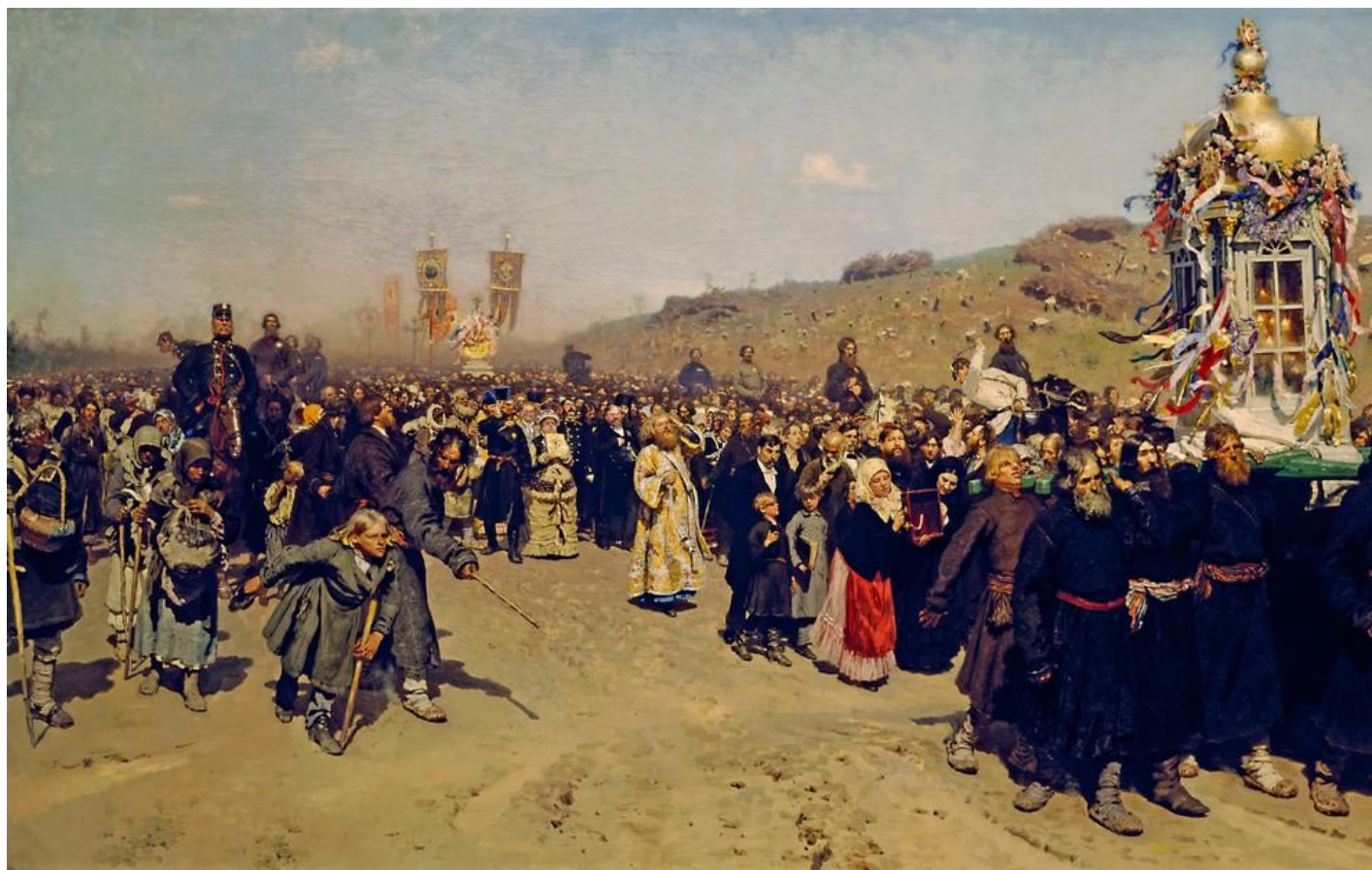
«Крестный ход в Курской губернии» (1880—1883 гг.)