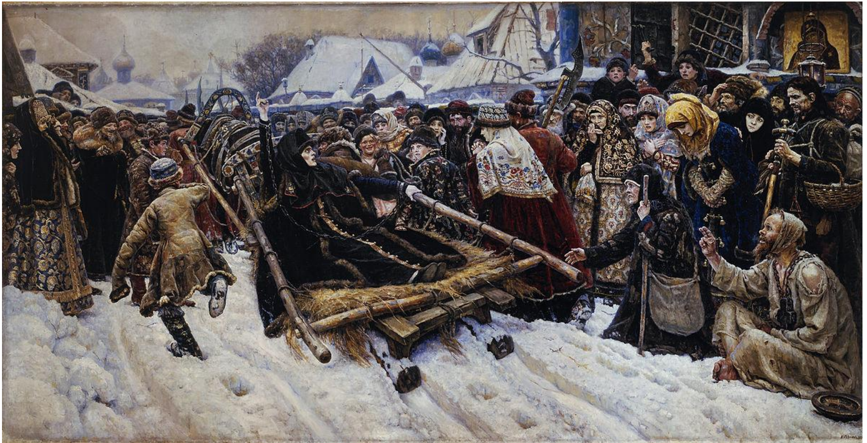
«Боярыня Морозова» (1887 г.)