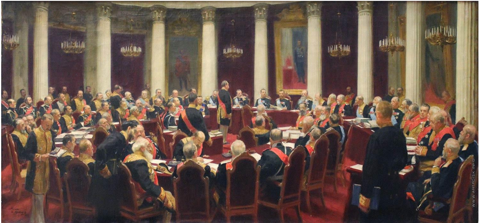
«Заседание Государственного совета». 1903 г.