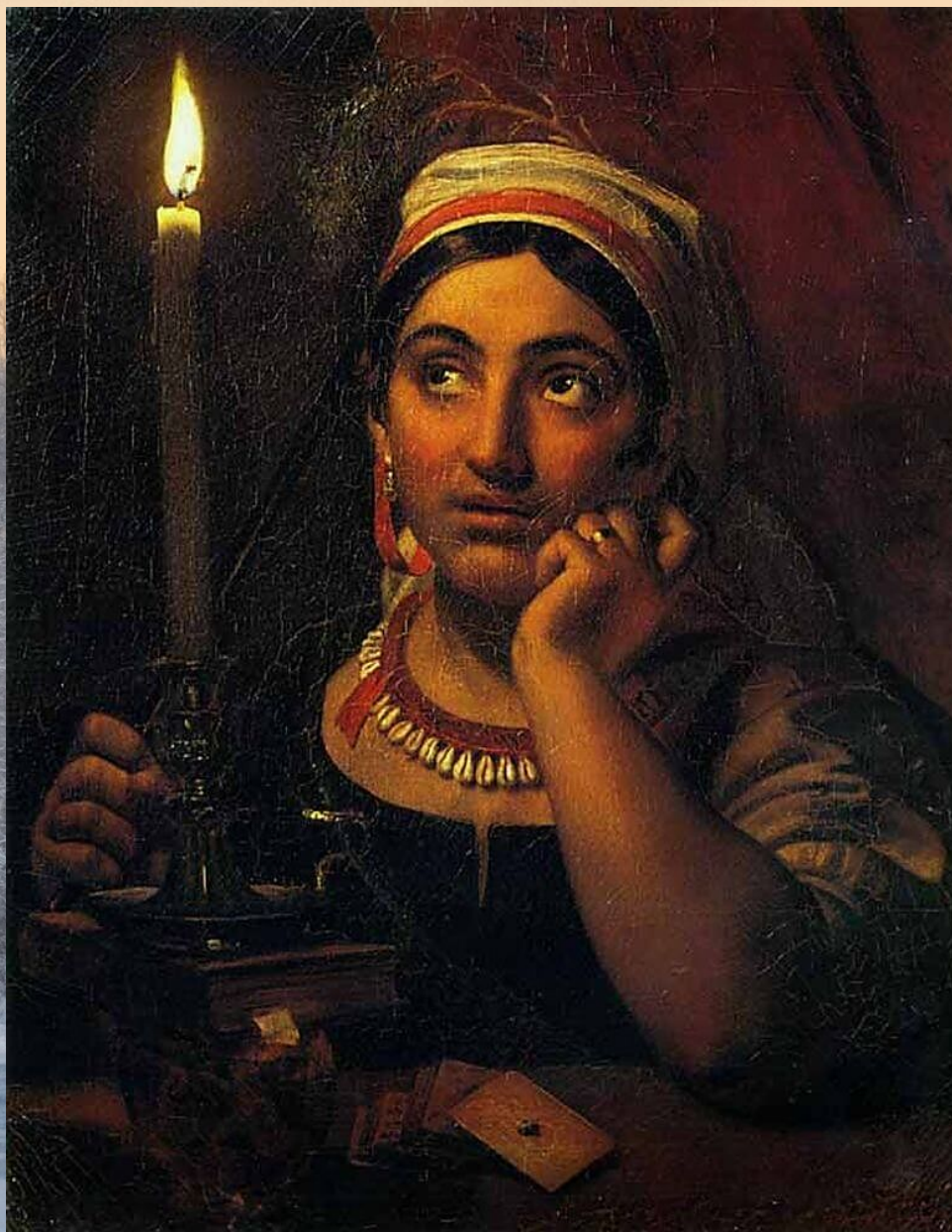
Кипренский О. «Гадалка со свечой»