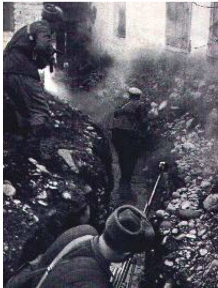
Бой за Моздок. Сентябрь 1942 г.

Начиная войну Гитлер рассчитывал, что СССР развалится как «карточный домик», но советский народ наоборот только сплотился.