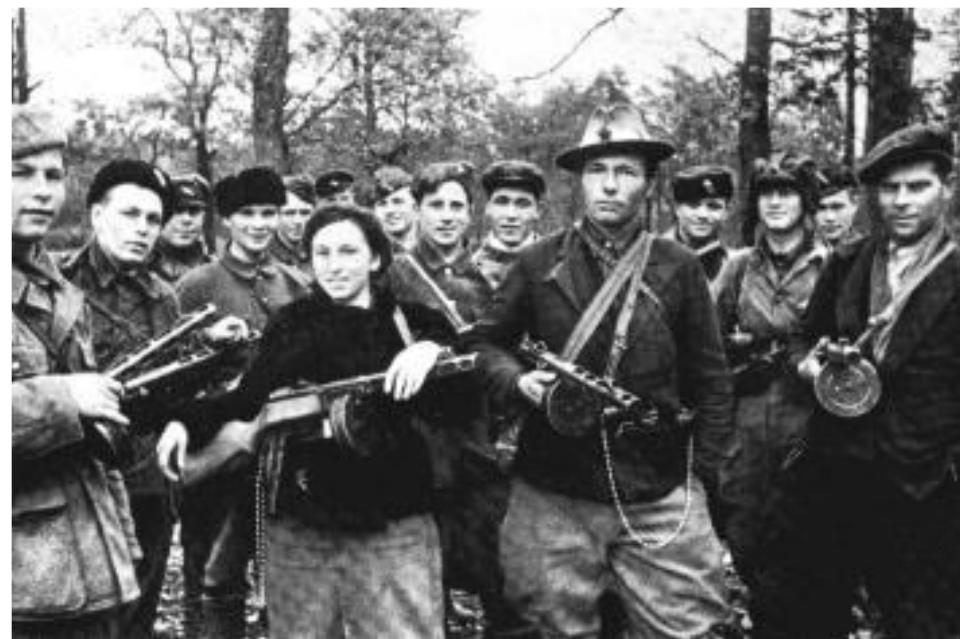
Партизанский отряд в Приднестровье. Апрель 1943 г.

Дружба людей разных национальностей помогла при защите Москвы, Ленинграда, Севастополя и т.д. Среди 11 тысяч героев СССР (в годы войны), были представители почти всех народов нашей страны.