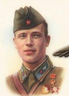
ТАЛАЛИХИН Виктор Васильевич (1918–1941)

Советский офицер, танковый ас. За два месяца 1941 г. уничтожил 52 танка противника, став самым результативным танкистом в Красной армии за всю историю Великой Отечественной войны. Погиб защищая Волоколамск.