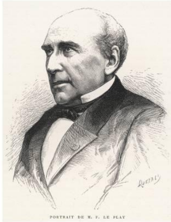
Фредерик Пьер Ле Пле

Концепт «от семьи – института к супружескому партнерству»