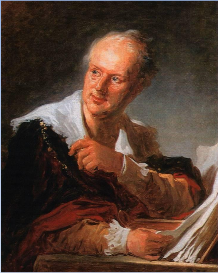
О. Фрагонар «Портрет Дени Дидро» 1765-1769

Дени Дидро – французский писатель, драматург, просветитель, философ.