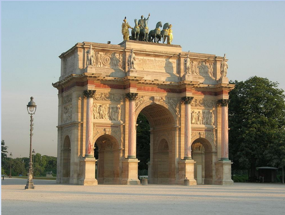
Триумфальная арка на площади Каррусель в Париже. 1806 г.

Своё художественное продолжение он нашёл в стиле ампир (фр. empire - империя).