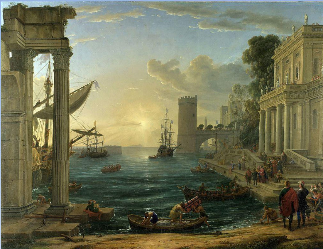
Клод Лоррен «Отплытие царицы Савской» (1648)

Развивая идеалы эпохи Возрождения, искусство классицизма стремилось отражать идеи гармонического устройства мира, подчинения индивидуальности интересам общества и государства.