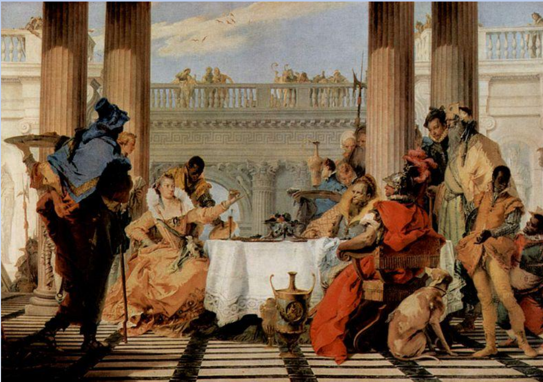
Джованни Баттиста Тьеполо «Пир Клеопатры» 1750