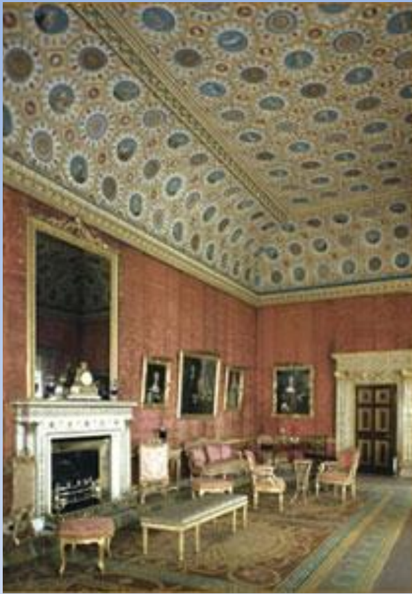
Интерьер английского дворца

Французскому образцу в этот период подражали в Испании, Германии и в странах Восточной Европы. Даже Англия вынуждена была признать авторитет французской культуры.