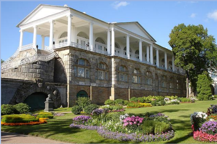
Камеронова галерея, Царское село