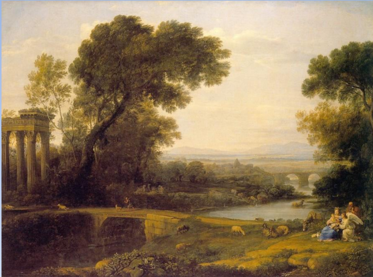
Клод Лоррен «Полдень. Отдых на пути в Египет» 1661

В соответствии с античной традицией был провозглашён принцип первенства природы, которой должно подражать искусство.