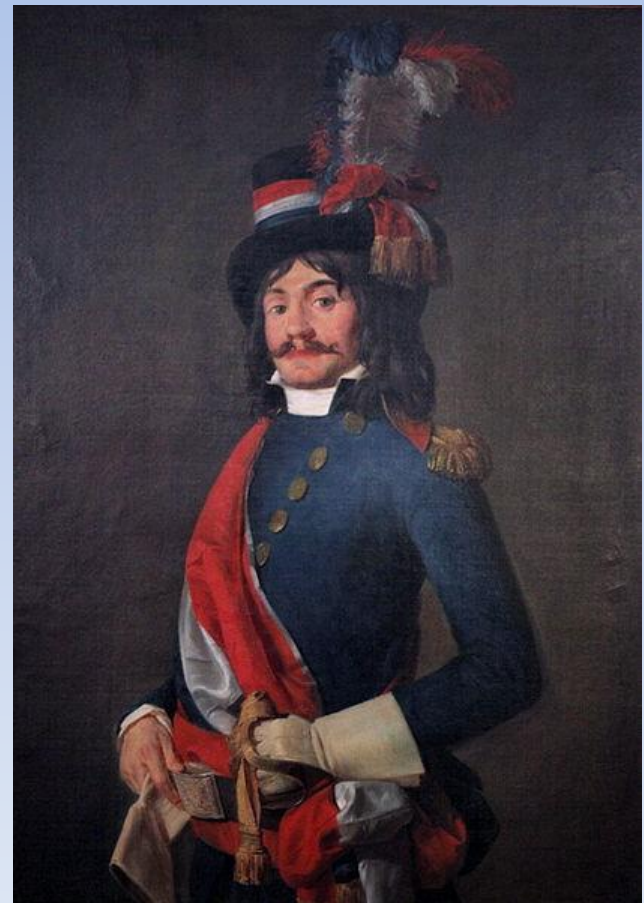
Ж.-Б. Мийо «Депутат революционного Конвента» 1794

Главным содержанием искусства классицизма стало понимание мира как разумно устроенного механизма, где человеку отводилась существенная организующая роль.