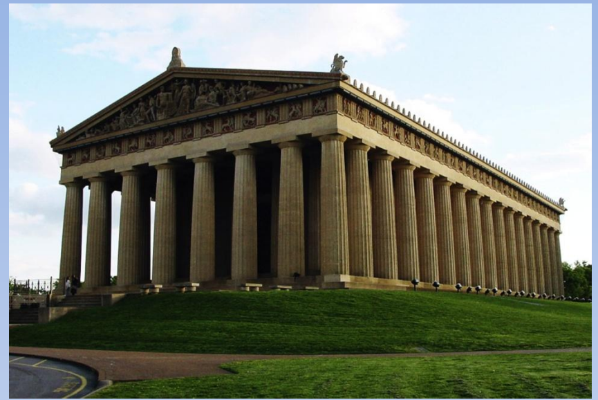
Парфенон, реконструкция, США

Искусство Древней Греции и Древнего Рима стало для классицизма главнейшим источником тем и сюжетов.