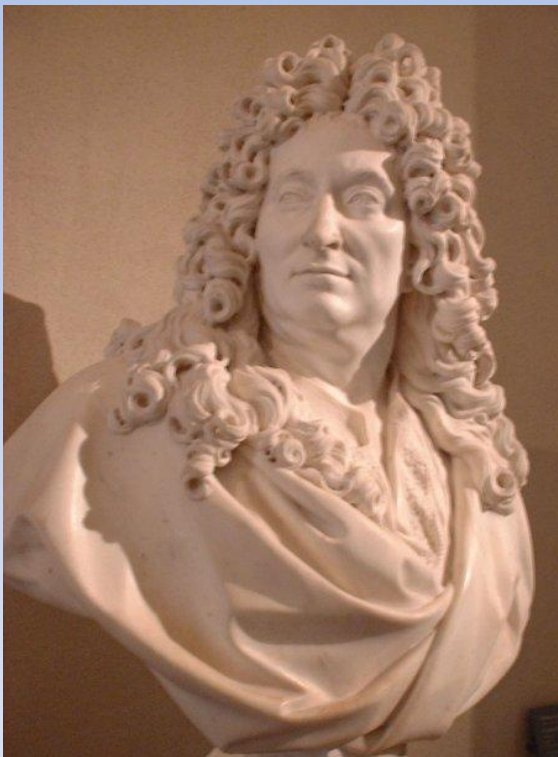
Бюст Никола Буало работы Ф. Жирардона.

Особую роль в решении просветительской задачи играли литература и в особенности театр , ставший самым массовым видом искусства этого времени.