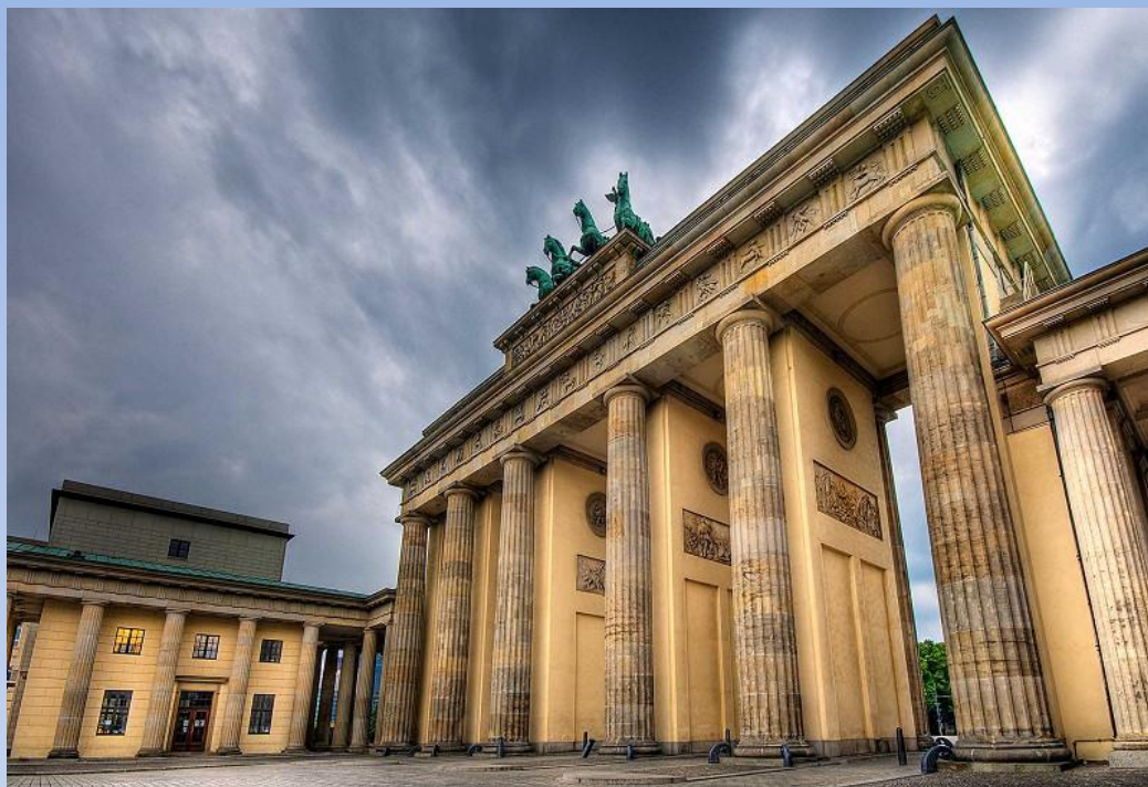
Бранденбургские ворота Берлин 1791

Во Франции была выработана некая идеальная модель , позволившая стать основой творчества не только в собственной культуре, но и завоевать художественное пространство других европейских стран.