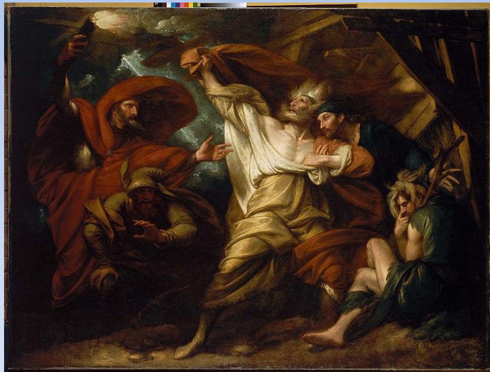
Шекспир «Король Лир» сцена из спектакля