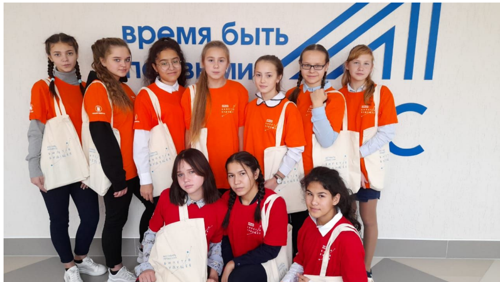
МБОУ «Ягуновская СОШ» Кемеровский МО