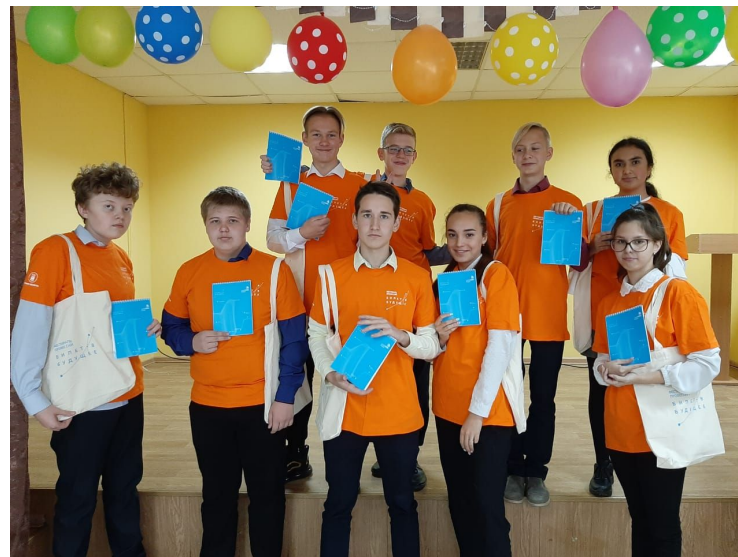
МБОУ «Маталлплощадская СОШ» Кемеровский МО