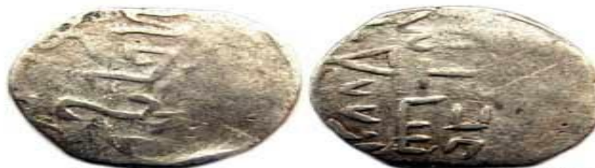
Монета Дмитрия Ольгердовича, Брянск, 1373-1376 гг. Серебро, диаметр 16 мм, вес 1.10 гр.