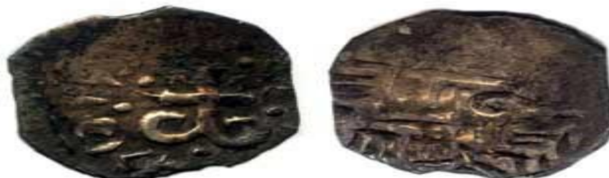
Монета Александра Наримонтовича, Стародуб, 1367-1370 гг. Серебро, диаметр 16 мм, вес 1.45 гр.