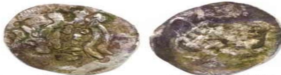
Монета Ягайло Ольгердовича, Вильно, 1387-1388 гг. Серебро, диаметр 14 мм, вес 0.60 гр.