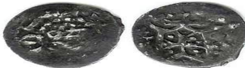
Монета Владимира Ольгердовича, Киев, 1363-1377 гг. Серебро, диаметр 14 мм, вес 0.50 гр.