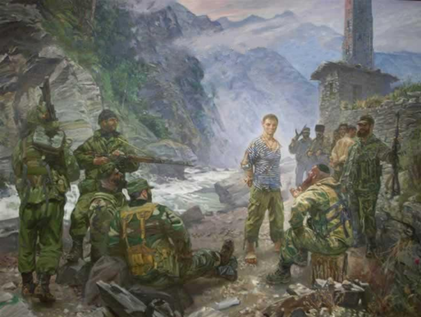
Картина русского православного художника Максима Фаюстова: «Русский мученик Евгений Родионов».