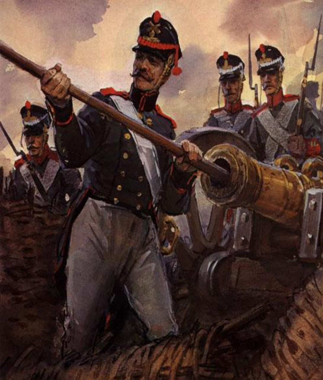
В. Шевченко. Артиллеристы на Бородинском поле.