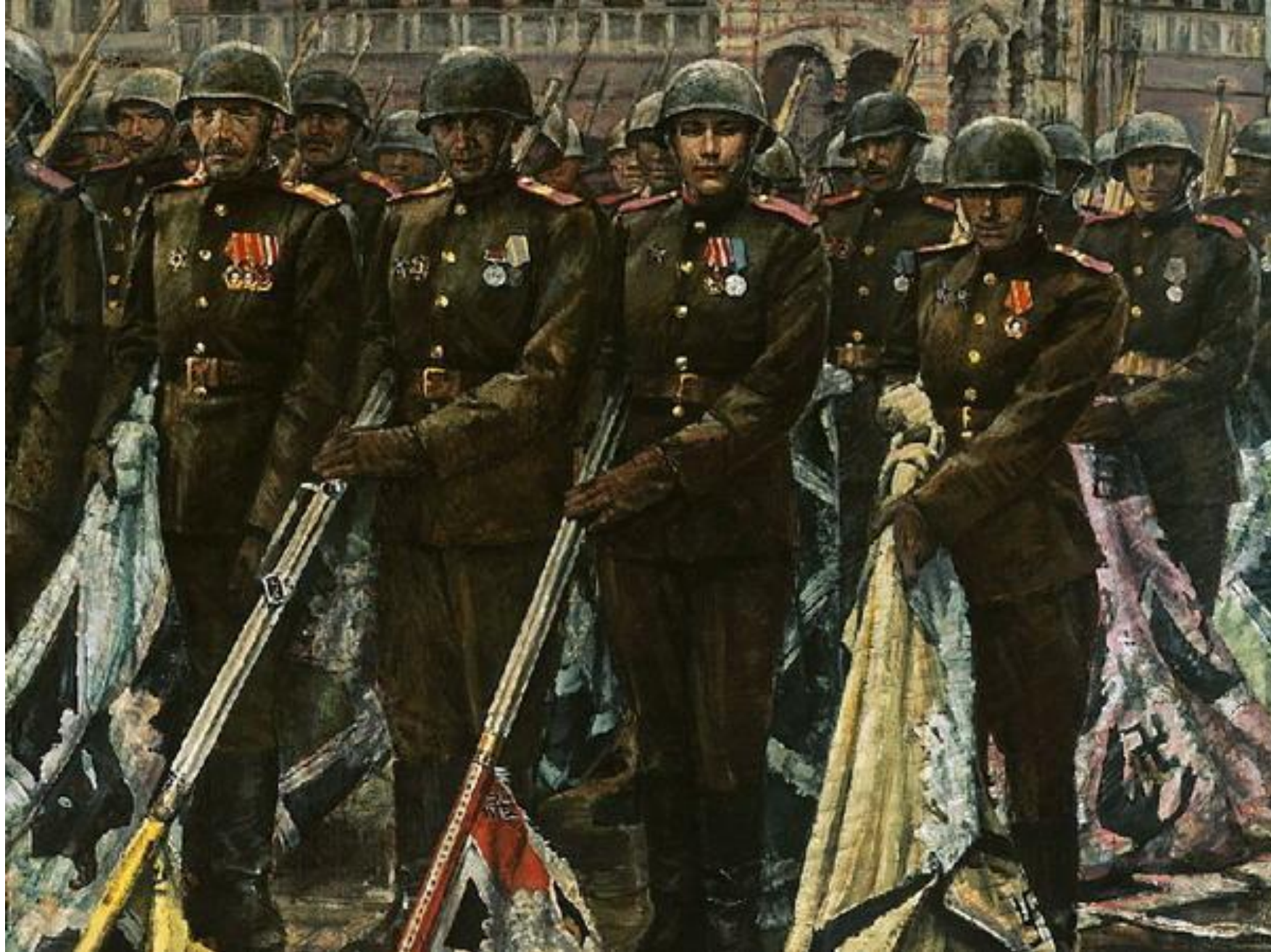
К. Антонов. «Победители».