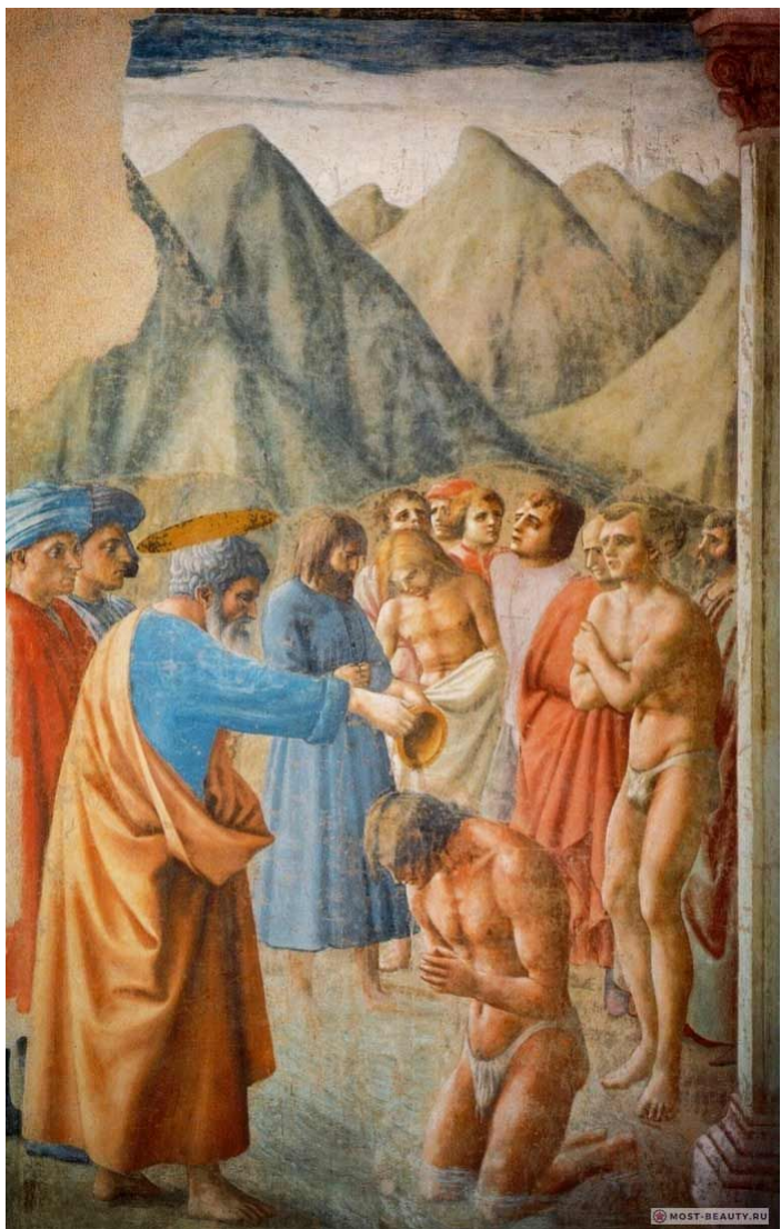
Фреска Крещение Неофитов