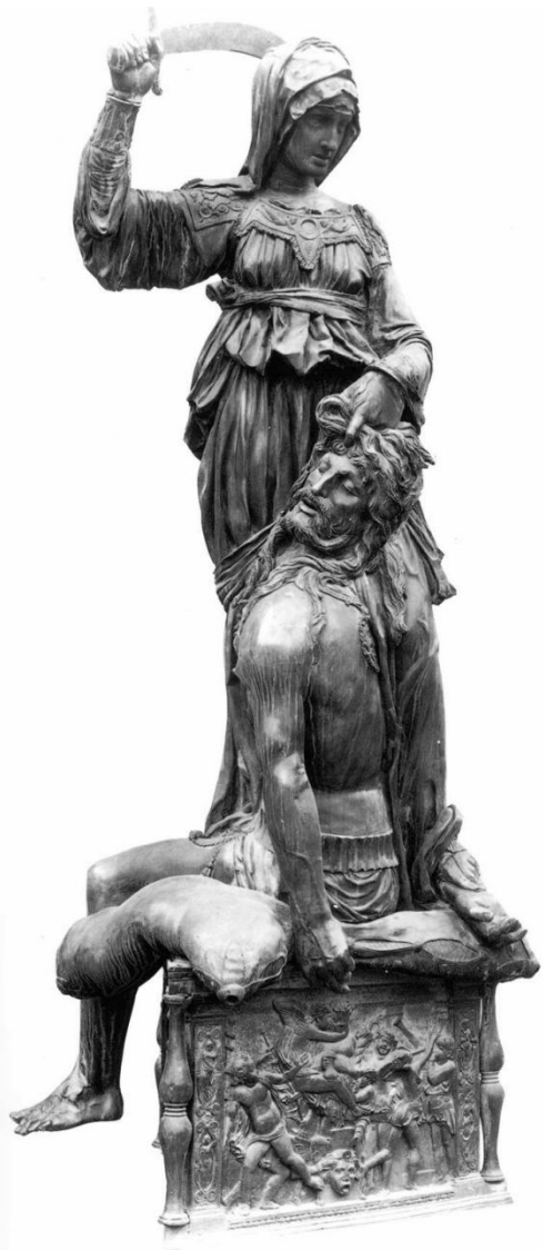
Статуя Прекрасная Юдифь