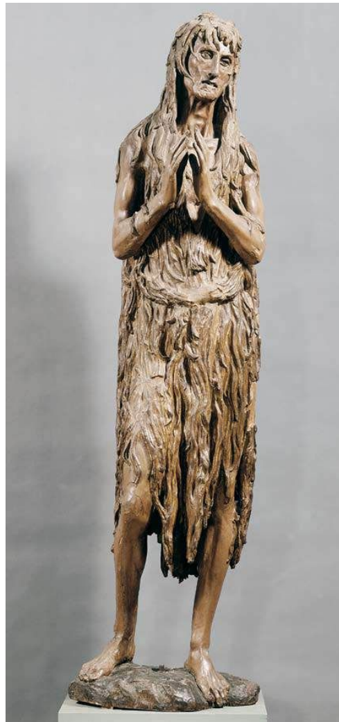
Статуя Мария Магдалина