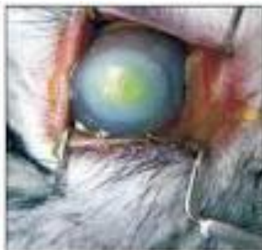
Рис. 2. Ослепший глаз - 7-е поколение протезов