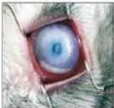
Рис. 1. Контрольный глаз - 7-е поколение протезов