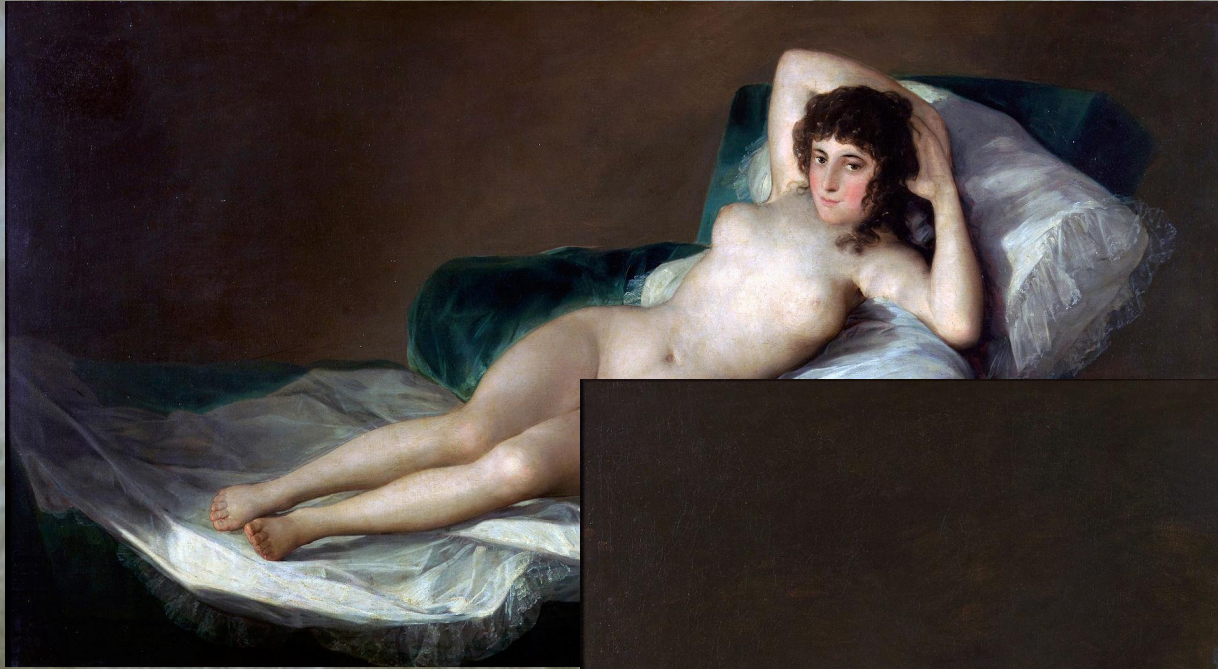
«Маха оголена», 1790–1800