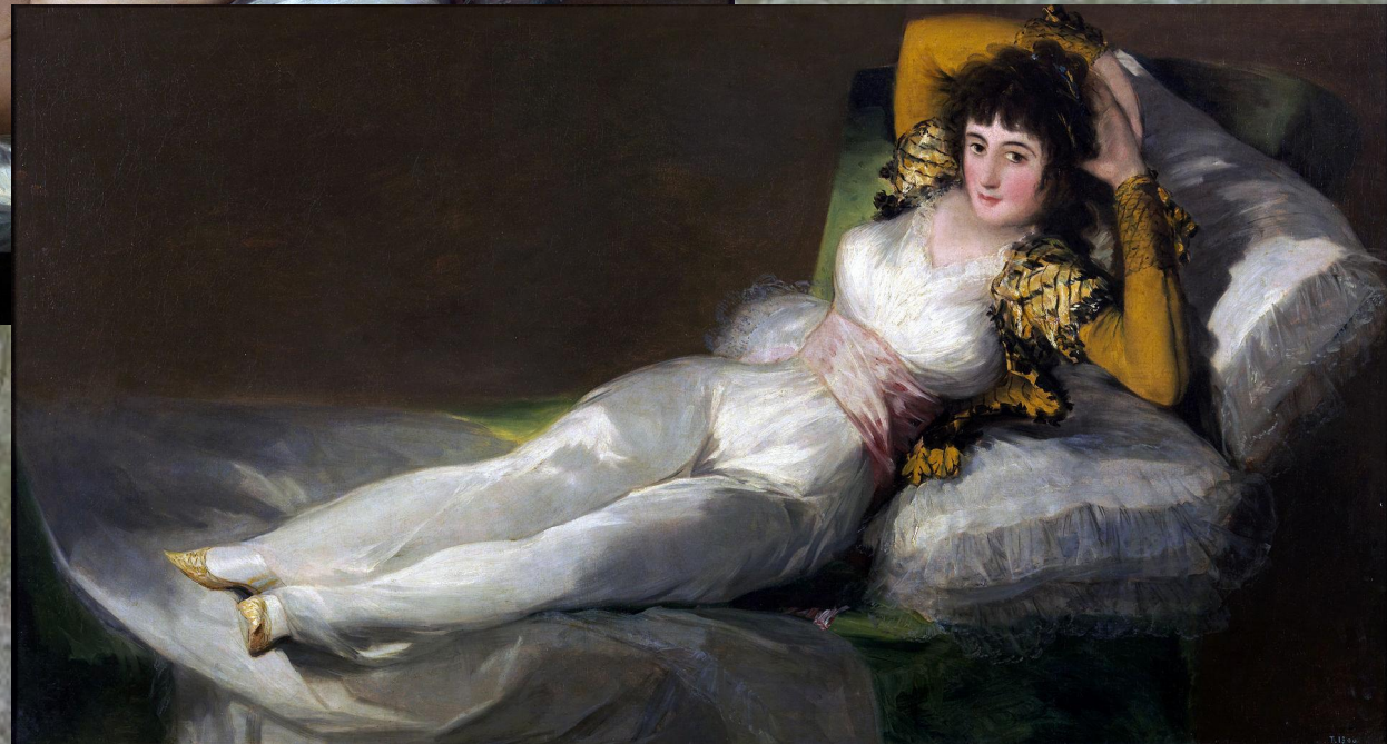
«Маха одягнена», 1802–1805