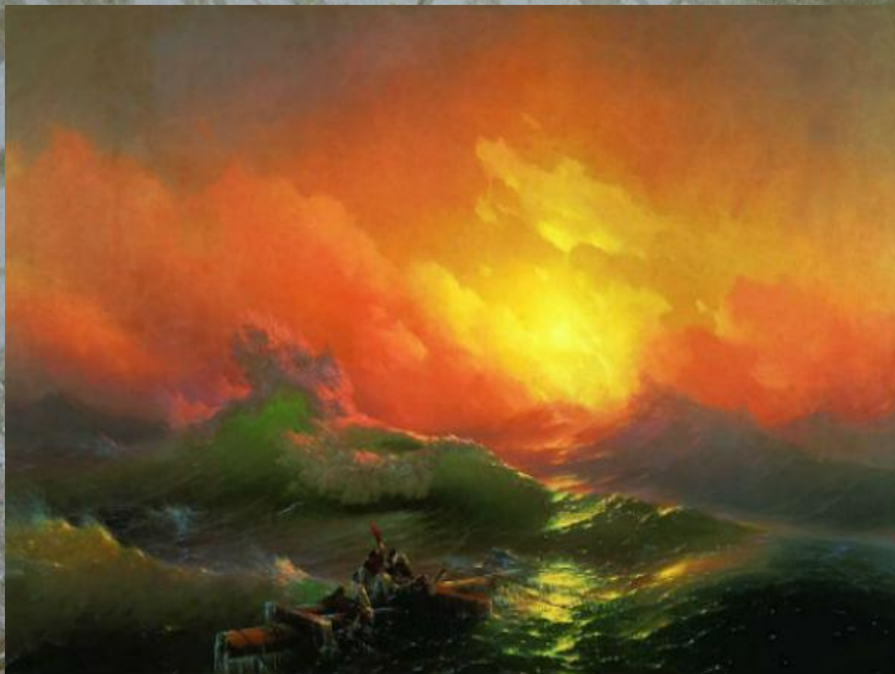
Дев'ятий вал. 1850