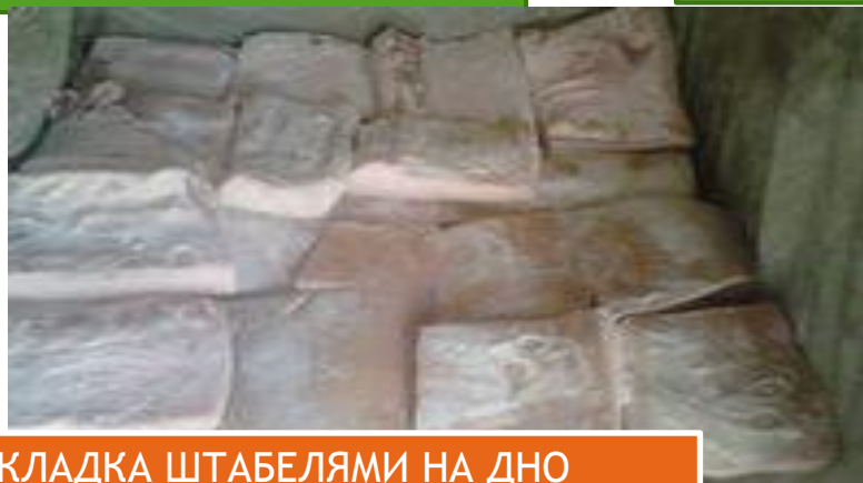
УКЛАДКА ШТАБЕЛЯМИ НА ДНО ЯЩИКОВ, ВЫДЕРЖКА 2-4т 7-10 дней