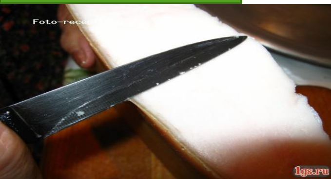
Нарезание на пластины