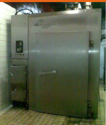
Копчен ие t 18 -22 с. 6-12 ч.