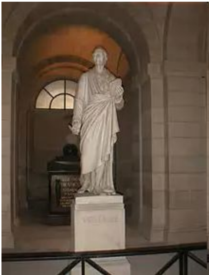
Пантеондағы Вольтер басы