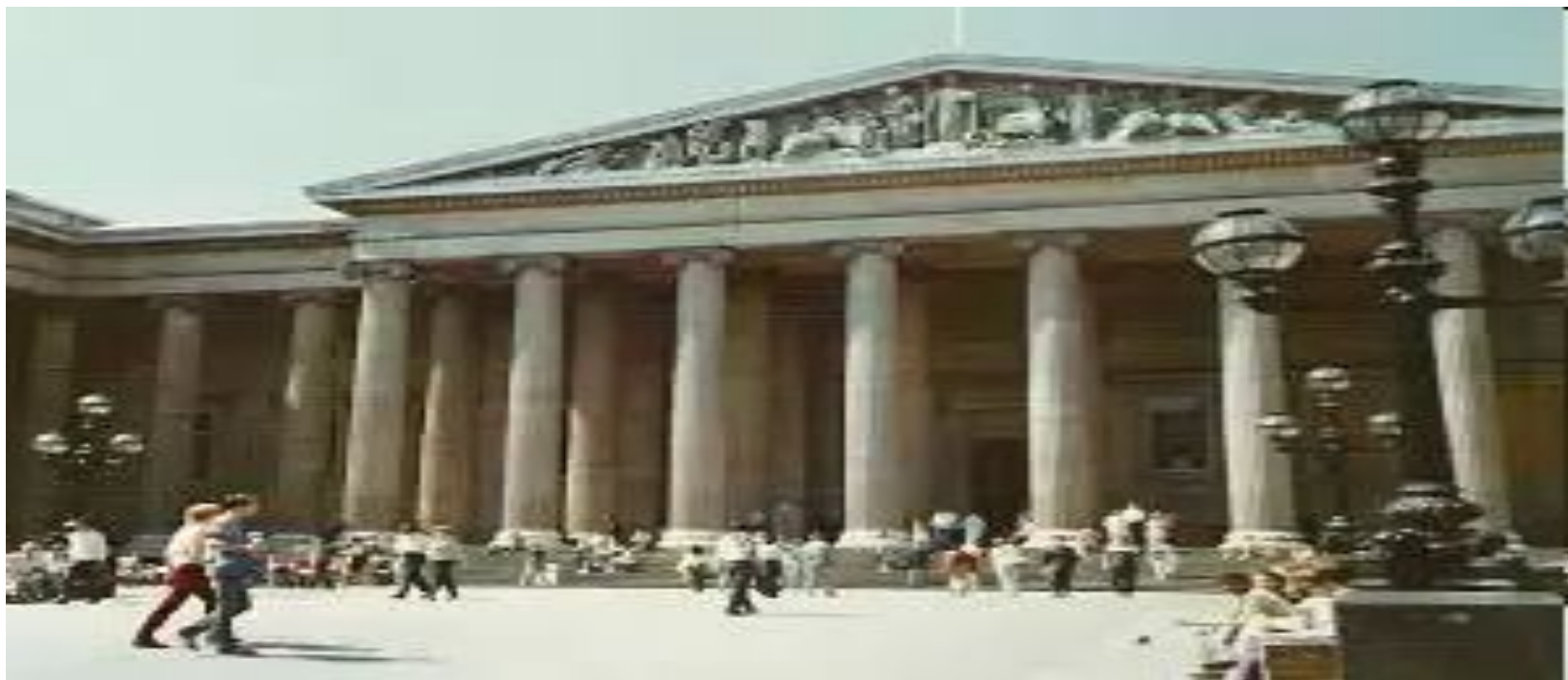
Лондондагы Британдық мұражай