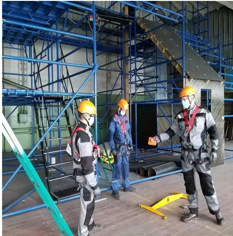
Учебно-тренировочный полигон «Высота»