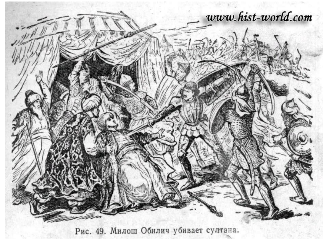
Рис. 49. Милош Обилич убивает султана.

1389 – состоялось решающее сражение между турками-османами и сербами – героическая и трагическая страница истории Сербии - Битва на Косовом поле. У турок было в три раза больше войск, чем у сербов. Силы сербов были ослаблены раздорами между князьями. Многие князья не явились со своими отрядами на поле боя; другие лишь наблюдали за ходом битвы, но так и не приняли в ней участия. С самого начала сражение было очень ожесточённым. Храбрый сербский патриот Милош Обилич, идя на верную смерть, пробрался в турецкий лагерь и поразил султана мечом. В стане турок возникло замешательство. Сербы начали теснить врага. Но сын султана ввёл в бой свежие отборные войска. Турки разгромили сербов, захватили в плен и убили их короля.