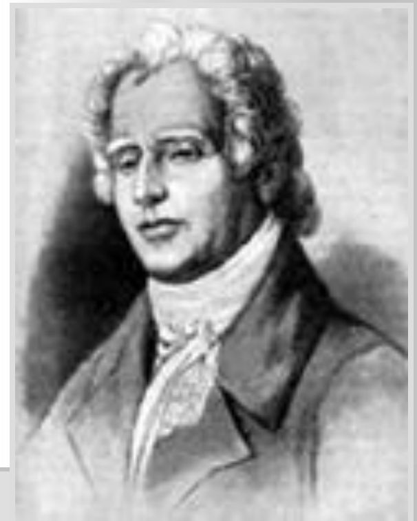
Дмитро Бортнянський (1751 - 1825)