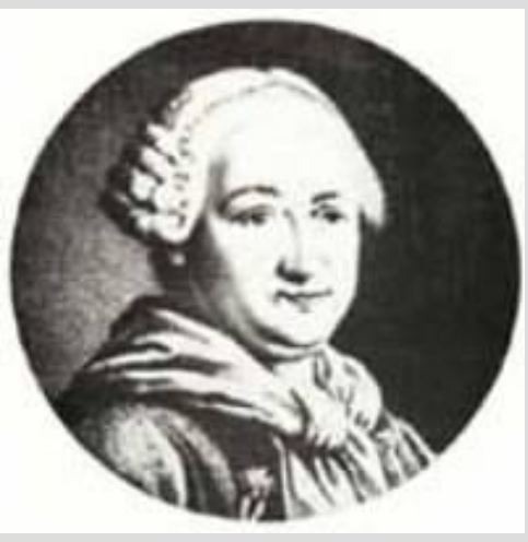
Максим Березовський (1745 - 1777)