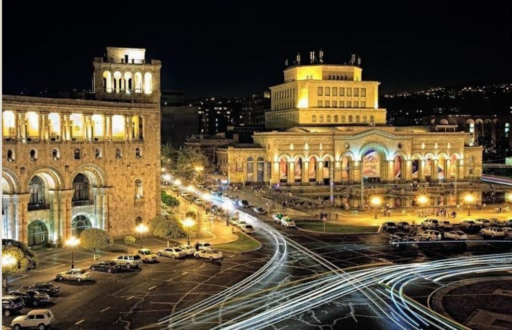
Площадь Республики в центре Еревана.