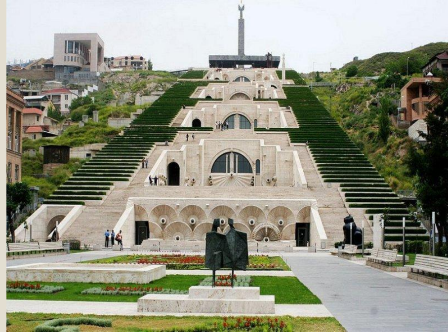
Каскад в 572 ступени. Наверху находится смотровая площадка и парк «Победы».