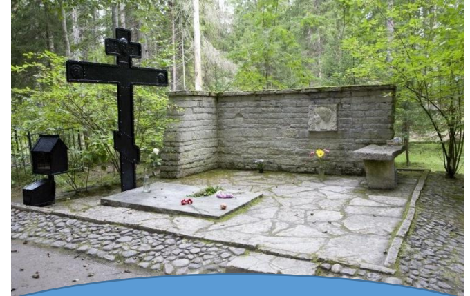
Могила на Комаровском кладбище (Санкт-Петербург)