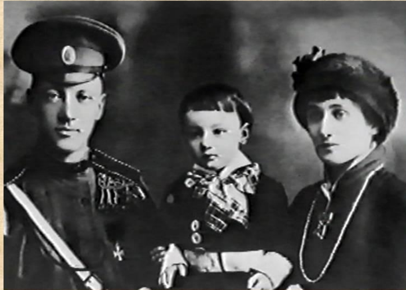
Н.С.Гумилев, Лев Гумилев, А.А.Ахматова. Царское Село. 1916 г.