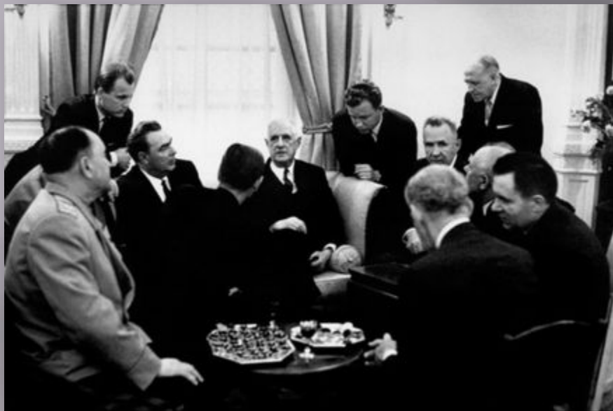
Встреча Л.И.Брежнева и Ш.де Голля в Москве, 1966 г.

Страны заключили договор о расширении политических, экономических и культурных связей. Обе стороны осудили американское вмешательство во внутренние дела Вьетнама, основали особенную политическую франко-русскую комиссию.