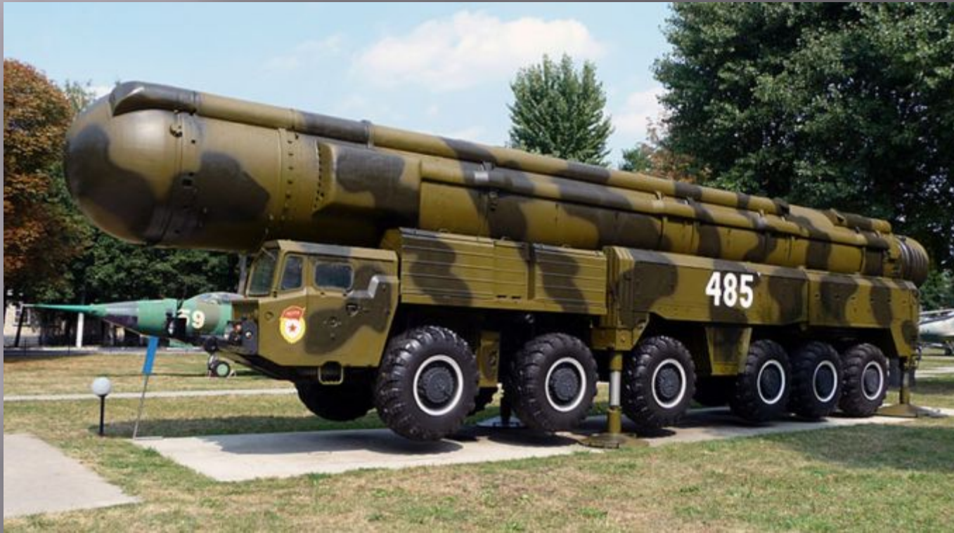
Ракетный комплекс средней дальности РСД-10 «Пионер» (SS-20) Принят на вооружение в 1976 году