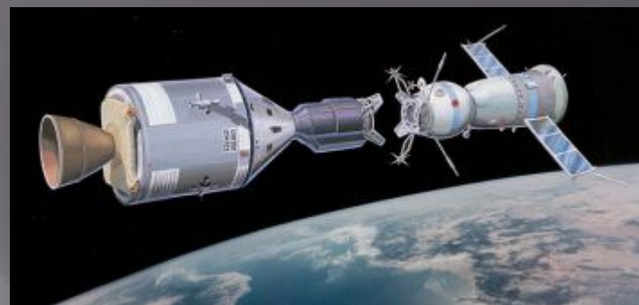
Союз-Аполлон (художественная реконструкция)

Экипажи - Томас Стаффорд, Вэнс Бранд и Дональд Слейтон (Аполлон), Алексей Леонов и Валерий Кубасов (Союз-19).