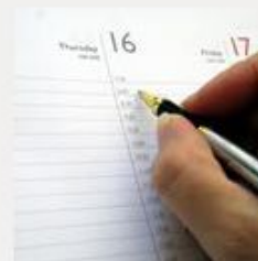
График учебного процесса на 2015- 2016 учебный год