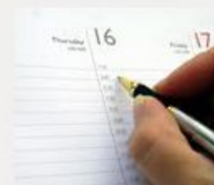
График учебного процесса на 2015- 2016 учебный год