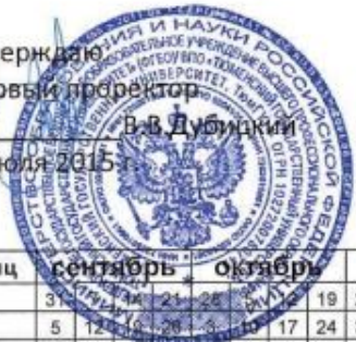
ГРАФИК УЧЕБНОГО ПРОЦЕССА на 2015-2016 учебный год Институт психологии и педагогики Очная форма обучения