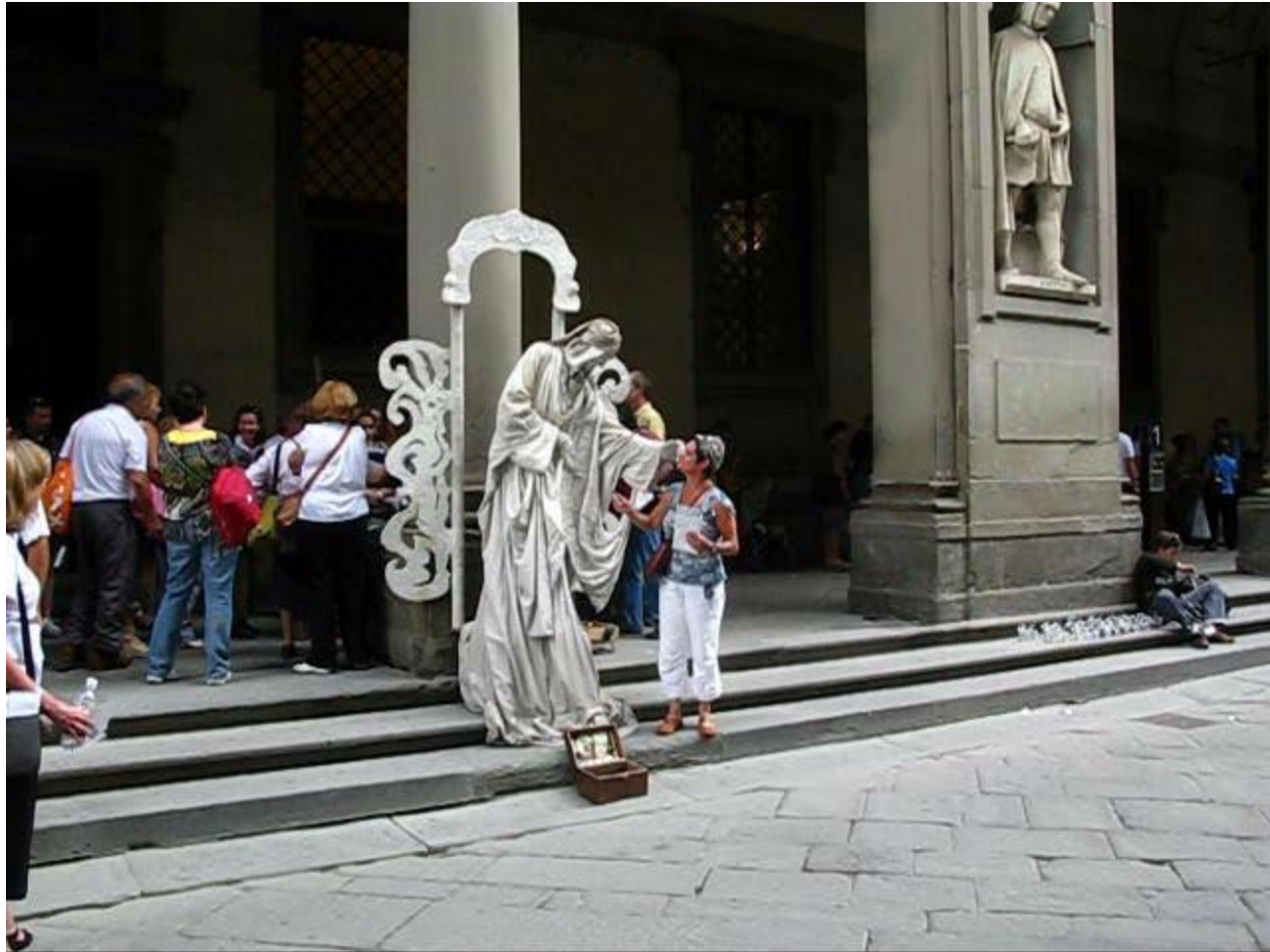
Внутренний двор Галереи Уффици. Оживают каменные статуи за небольшую плату.