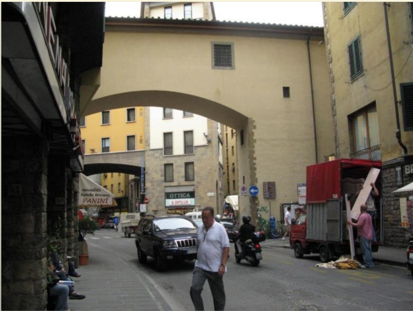
Современная жизнь в старой Флоренции