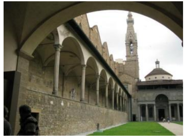
Внутренний двор церкви