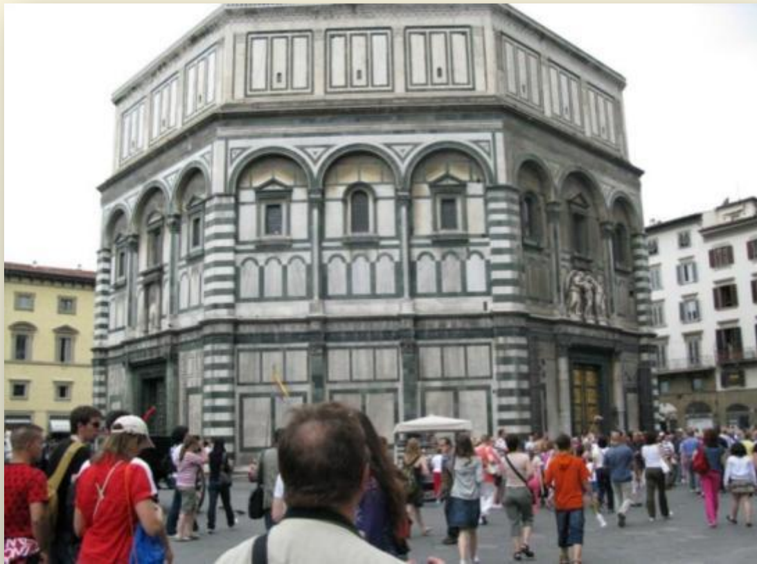
Лоренцо Гиберти . Бронзовые двери баптистерия. XV век.