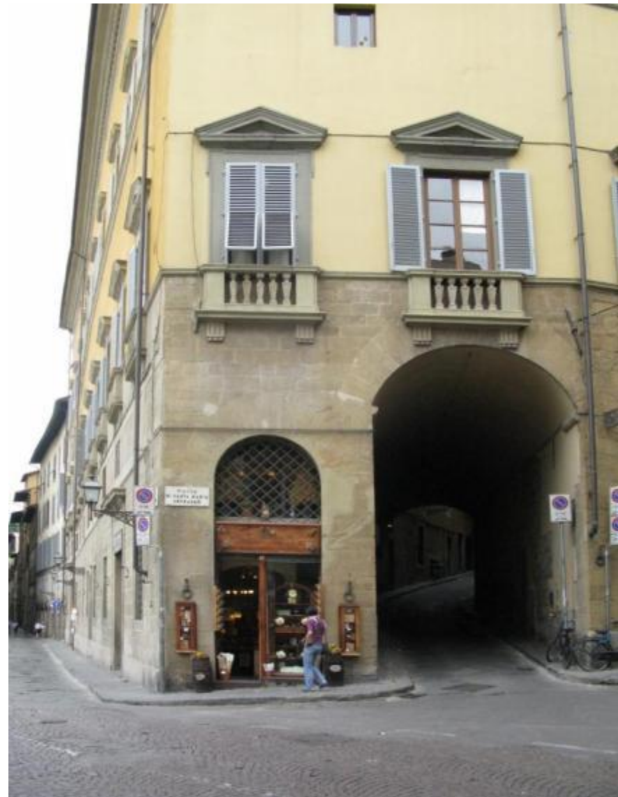
Галерея, ведущая вдоль набережной к старому мосту.