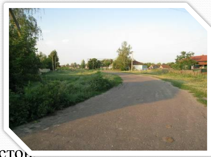
Фото: ул.Заречная – «Заречка»

Молодёжная, дома на которой были предназначены для молодых специалистов.