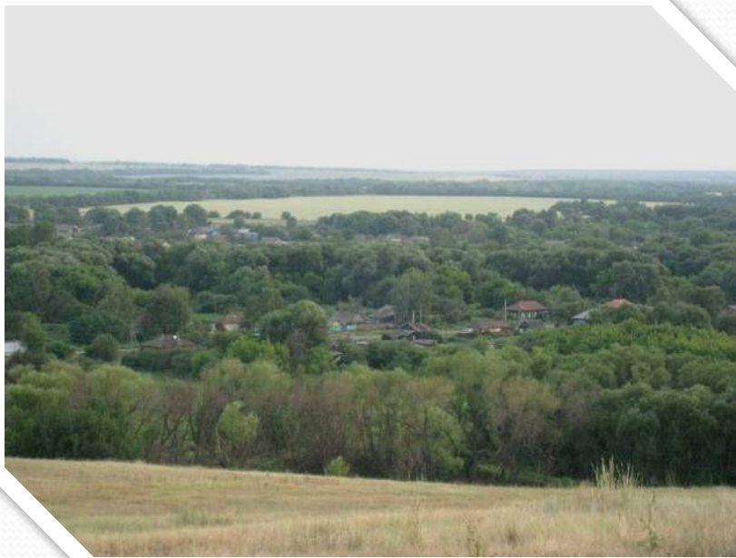
Фото: вид на с.М.Мелик

Меня город к себе не манит Шумом, спешкой и теснотой. У меня прописка иная -- С удивительной красотой. Здесь медовый и чистый воздух, Перекличка и пенье птиц. Здесь рябины рубины-гроздья И багряный разлив зарниц. Круглый год зеленеют ели, Ивы ветками льнут к воде... Не увидишь таких в музее И не купишь таких нигде. Родничок тут со мною рядом День и ночь без конца журчит... И петух, будто так и надо, По утрам мне «подъем» кричит. Что его воспевать я стану И гордиться, что здесь мой дом... Меня город к себе не манит, Нет единства с природой в нем.