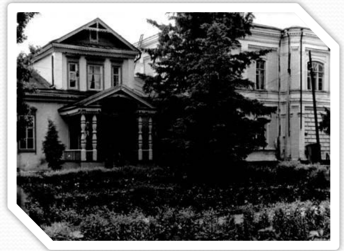
Фото: Усадьба К. Нарышкина

Таким образом, до революции 1917 г. с. М. Мелик было уделом помещика Нарышкина и до реформы 1861 года жители села несли повинности в пользу Нарышкиных.