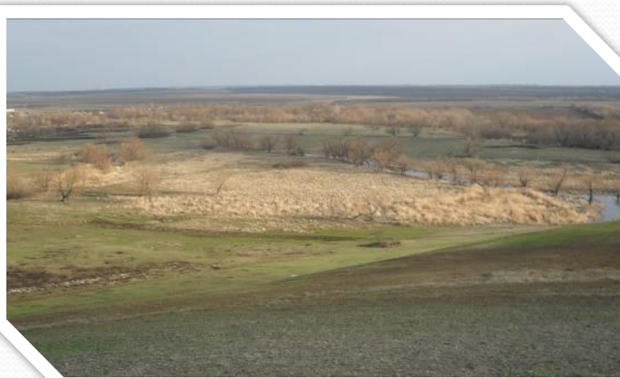
Фото: Вид на М.Мелик

По гидрониму реки и названо село. Местные жители с любовью называют свою Родину – Меличок.