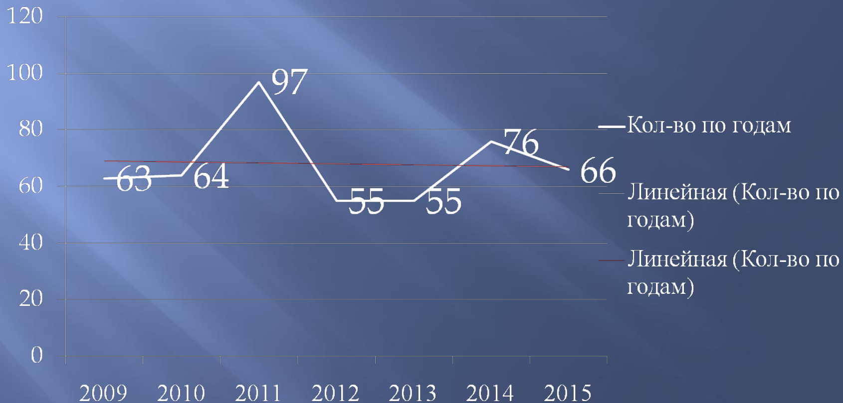
Кол-во по годам