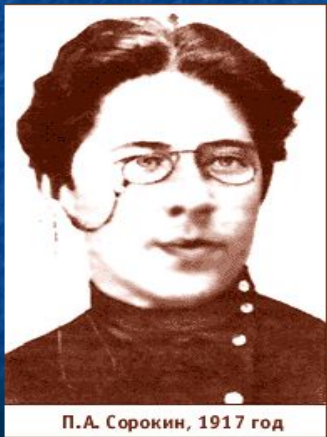
П.А. Сорокин, 1917 год

В 1922 г. Был выслан из России в США, где и прославился как социолог первой величины.