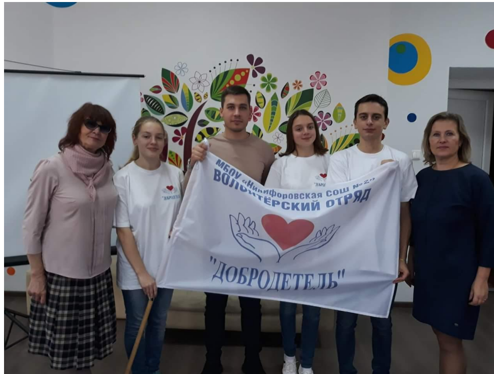
волонтерский отряд «Добродетель»

Собираю добро по крупинкам По частицам, по малым пылинкам. В сундуке, как скупец не храню Собираю и вновь раздаю.