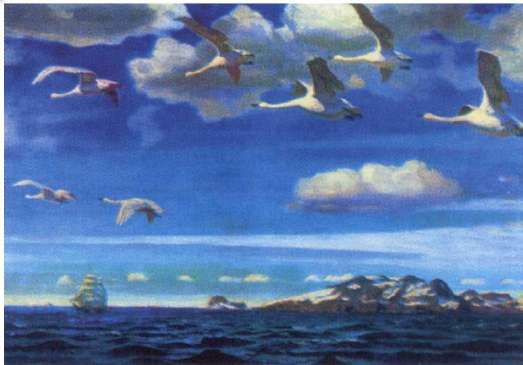
«В голубом просторе»