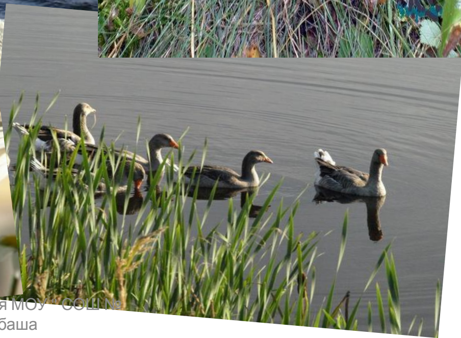
Учитель краеведения МОУ "СОШ № 6" г. Карабаша