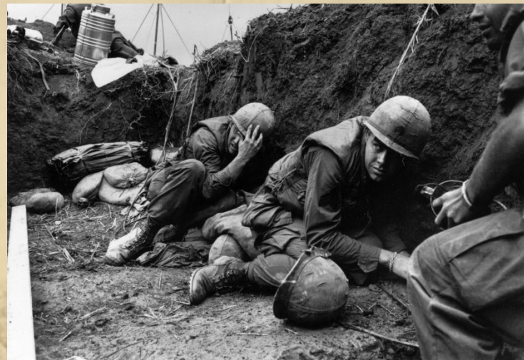
Война во Вьетнаме (1964–1975 гг.)