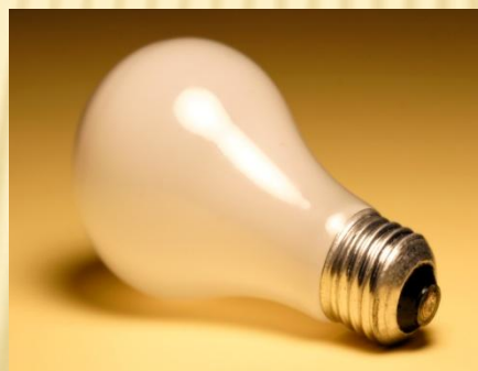
И примерно 386 лампочек