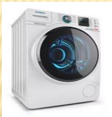
24 стиральные машинки