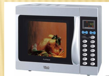
20 микроволновых печей