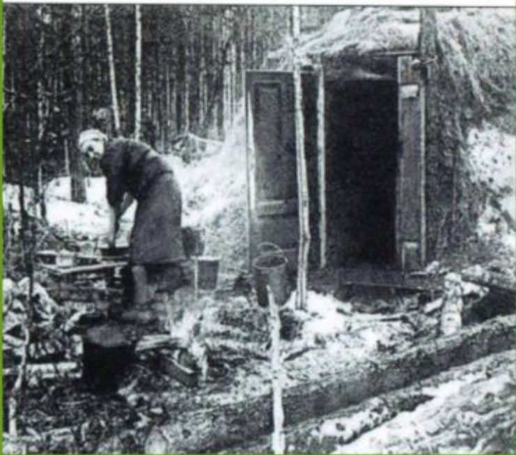
Лесний лагерь партизанского отряда Медведєва под Ровно

В історії Черкаського краю назавжди залишиться ім'я Володі Саморухи, уродженця села Коритні, що на Монастирищині. 13-річний Володя був членом місцевої підпільної організації, керівництво якої послало його на Рівненщину для налагодження зв'язків із партизанським загonom Дмитра Медведєва. Юний зв'язковий здолав понад 500 км небезпечного шляху. Він став бійцем партизанського загону Д. Медведєва і, як засвідчують спогади командира, проявив неабиякий героїзм. За подвиги юного месника було нагороджено орденом Червоної Зірки і медаллю «Партизану Вітчизняної війни» I ступеня.