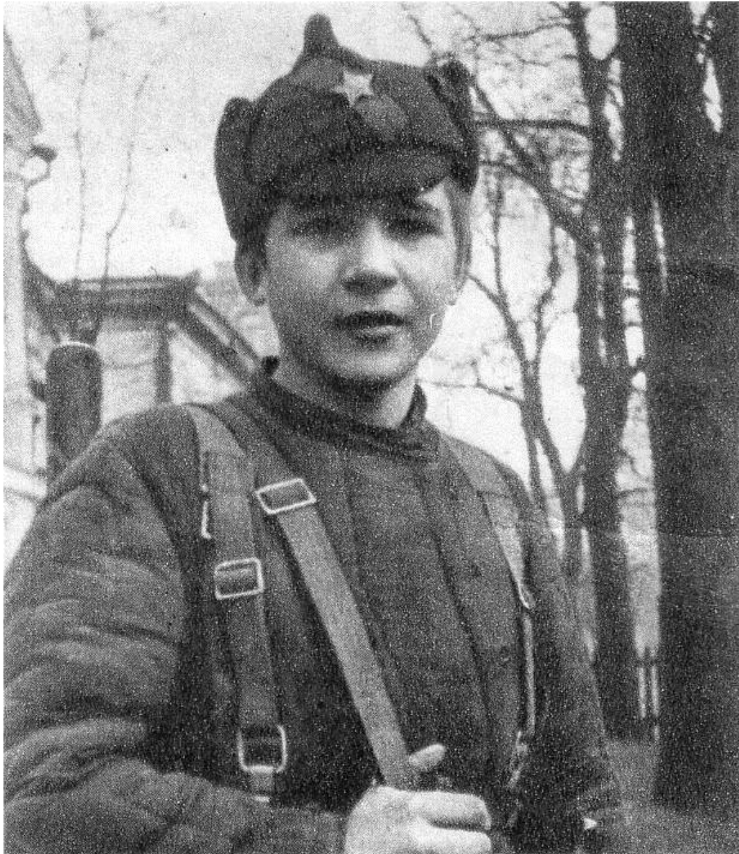
Юні учасники руху опору на Черкащині