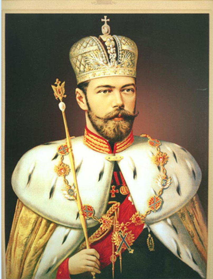
Его Императорское Величество Государь Император НИКОЛАЙ АЛЕКСАНДРОВИЧ.