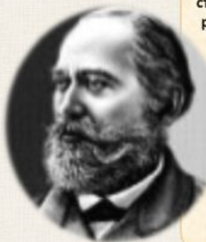
С.М. Соловьев (1820-1879гг)

ход истории нашей страны в переходе от родовых отношений к семье и далее к государственности.