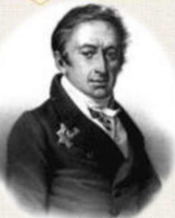
Н.М. Карамзин (1766-1826гг)

необходимость для России мудрого самодержавия