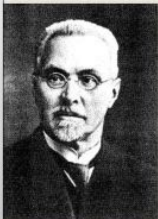
Ф. Платонов (1850-1933гг)

необходимо выявить всю совокупность фактов и факторов (географический, этнический, экономический, социальный, политический), характерных для каждого периода. "Человеческая природа, людское общество и природа страны - вот те три основные силы, которые строят людское общежитие"