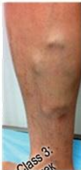
Class 3: Отек