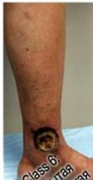
Class 6: Открытая трофическая язва