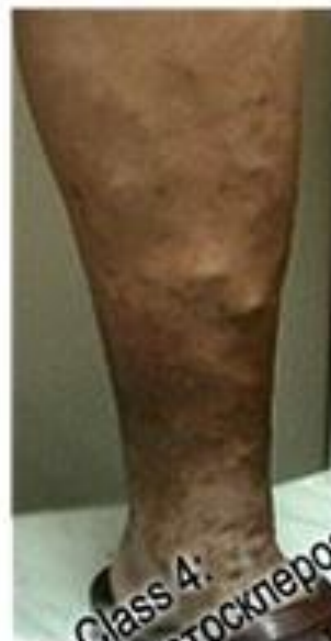
Class 4: Липодерматосклероз Экзема