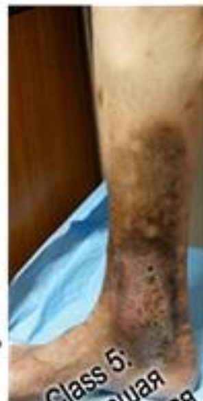
Class 5: Зажившая трофическая язва