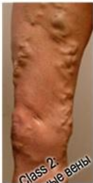
Class 2: Варикозные вены