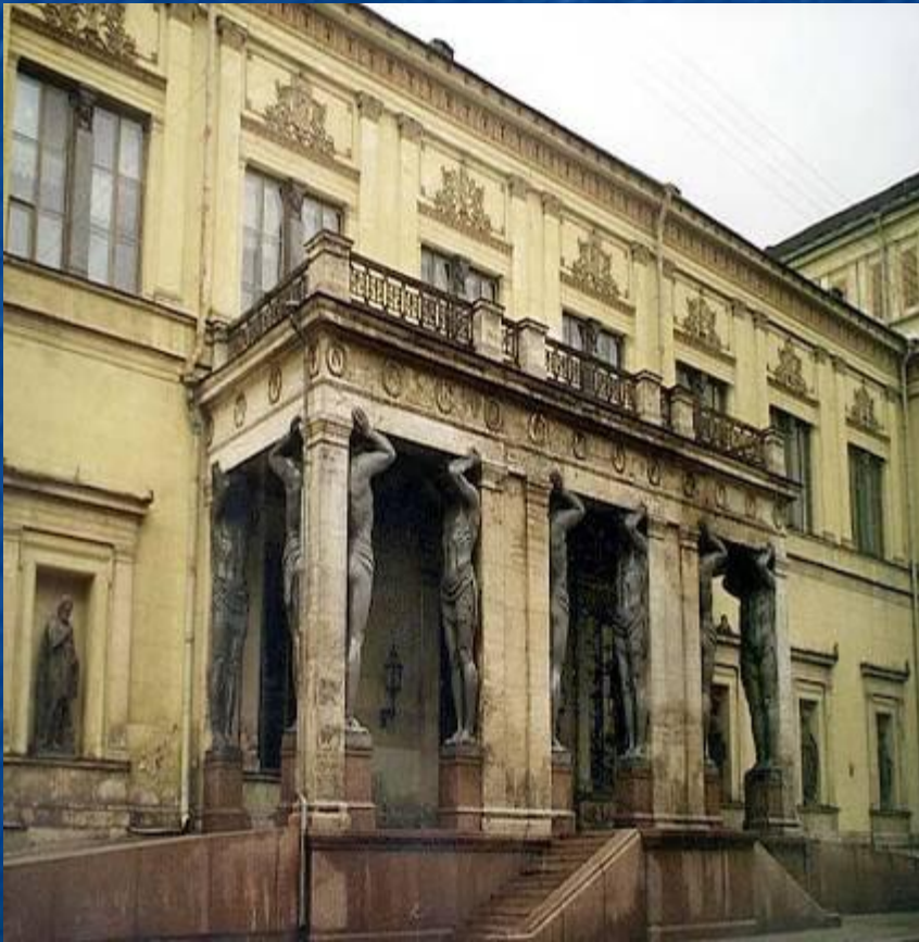
Портик Нового Эрмитажа