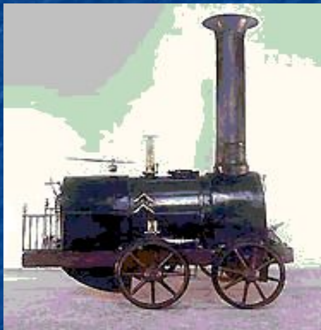
Модель первого российского паровоза (Черепановы)