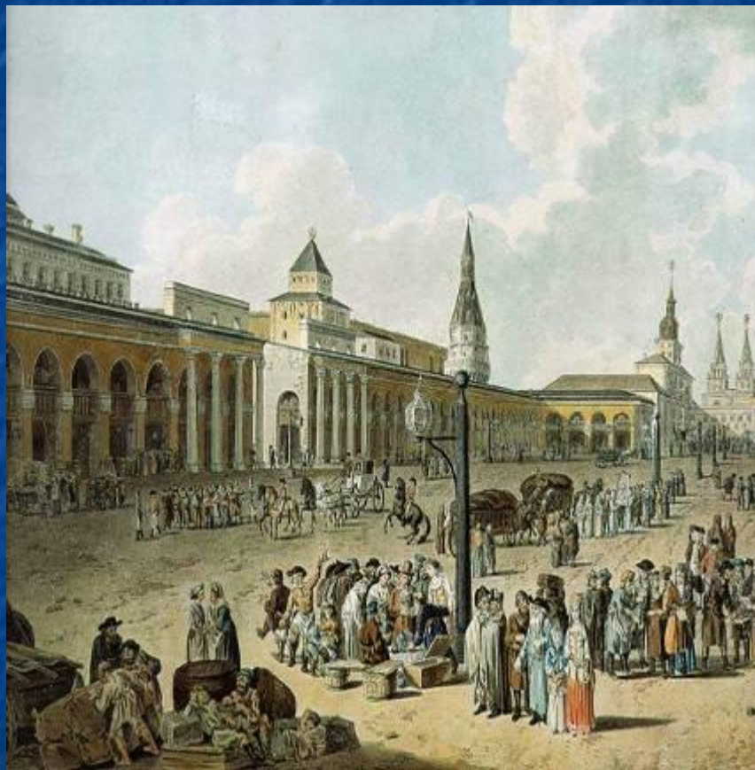
Вид на Красную площадь