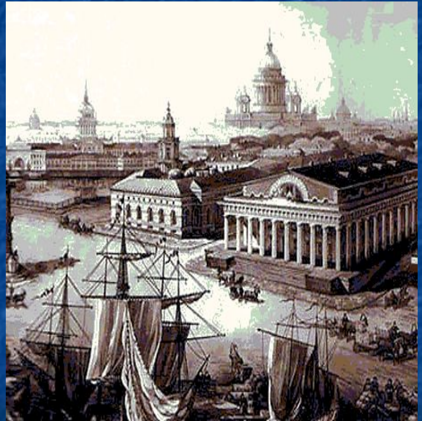
Стрелка Васильевского острова