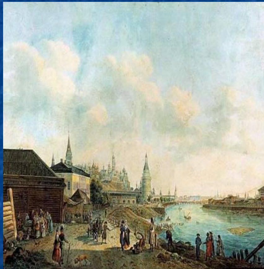
Набережная Москвы-реки. Вид на Кремль