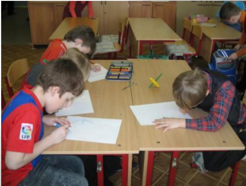
Рисунок будущего проекта или чертёж