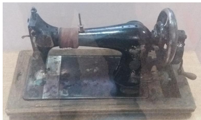
Ғайнижамал Ғайсинаның тігін машинасы

Алжир тұтқындары егін екті , мал бақты, құрылыс жұмыстарымен айналысты. Сонымен қатар тігін тікті