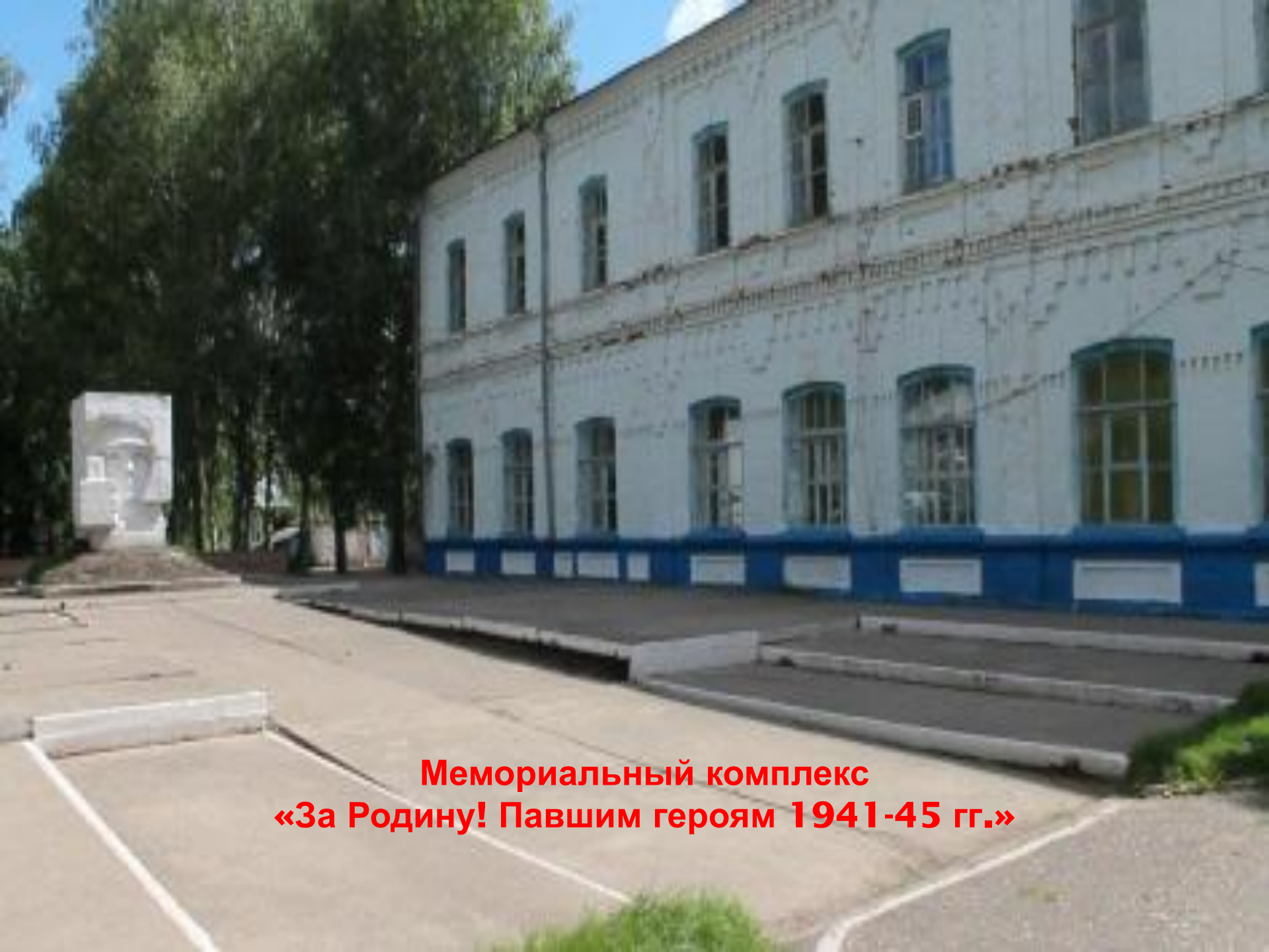
Мемориальный комплекс «За Родину! Павшим героям 1941-45 гг.»