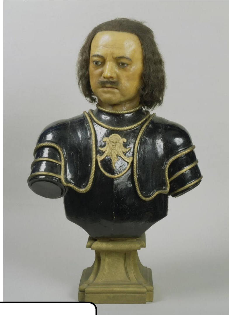
Портрет императора Петра I