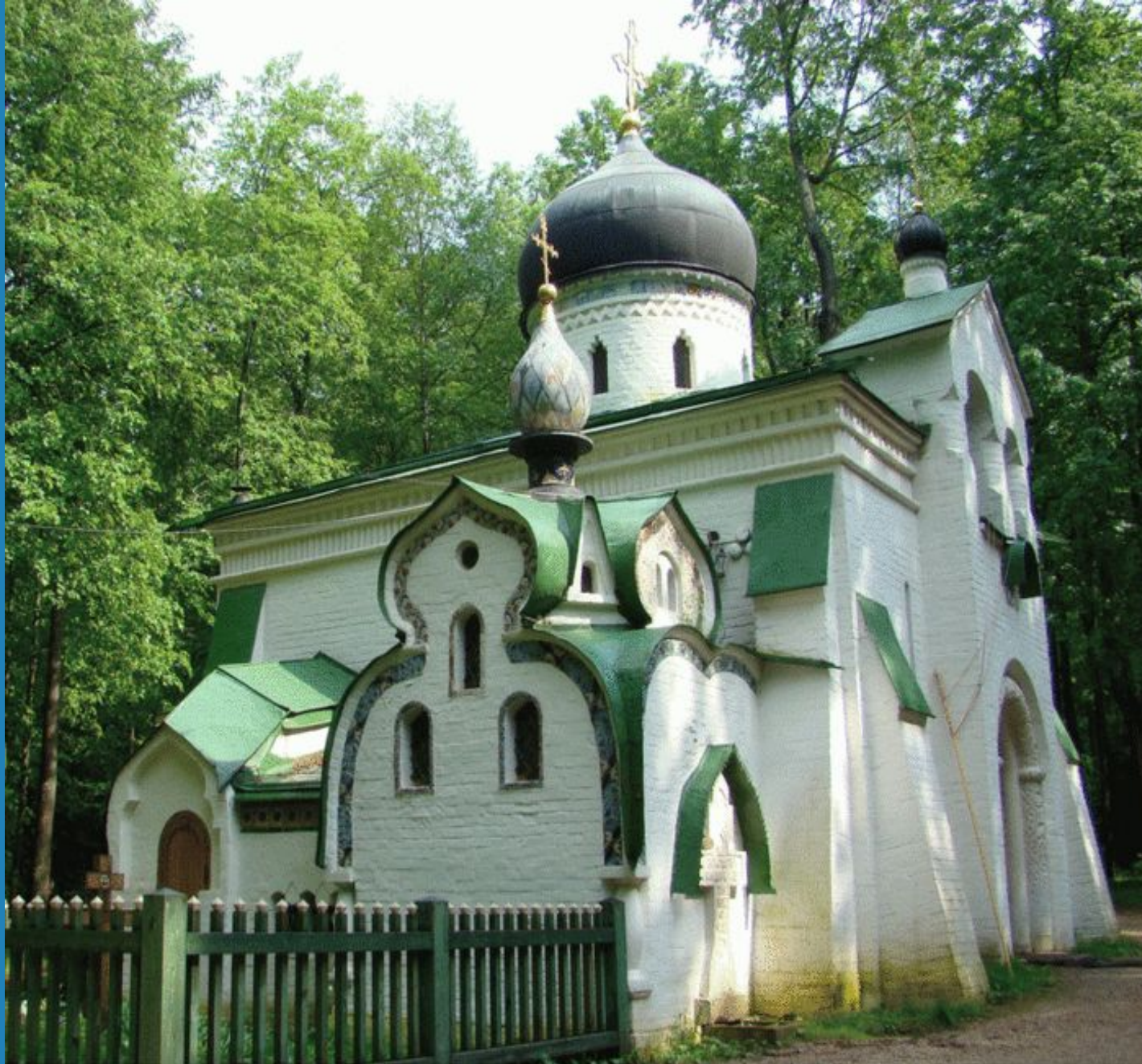
Абрамцевскую церковь, созданную и украшенную В.М.Васнецовым, И.Е.Репиным, В.Д.Поленовым и др. художниками, справедливо считают одним из первых образцов неорусского стиля