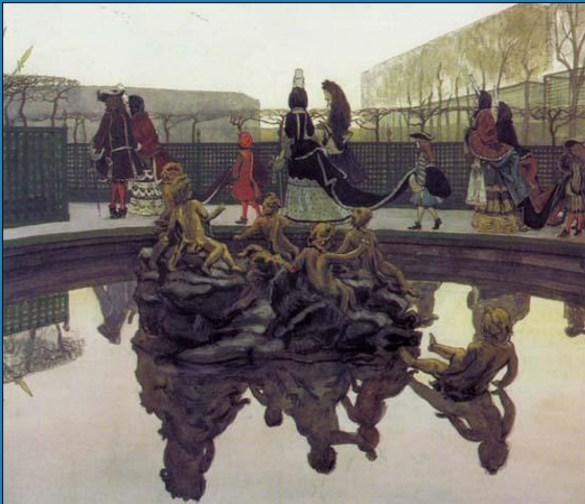
« Прогулка короля»